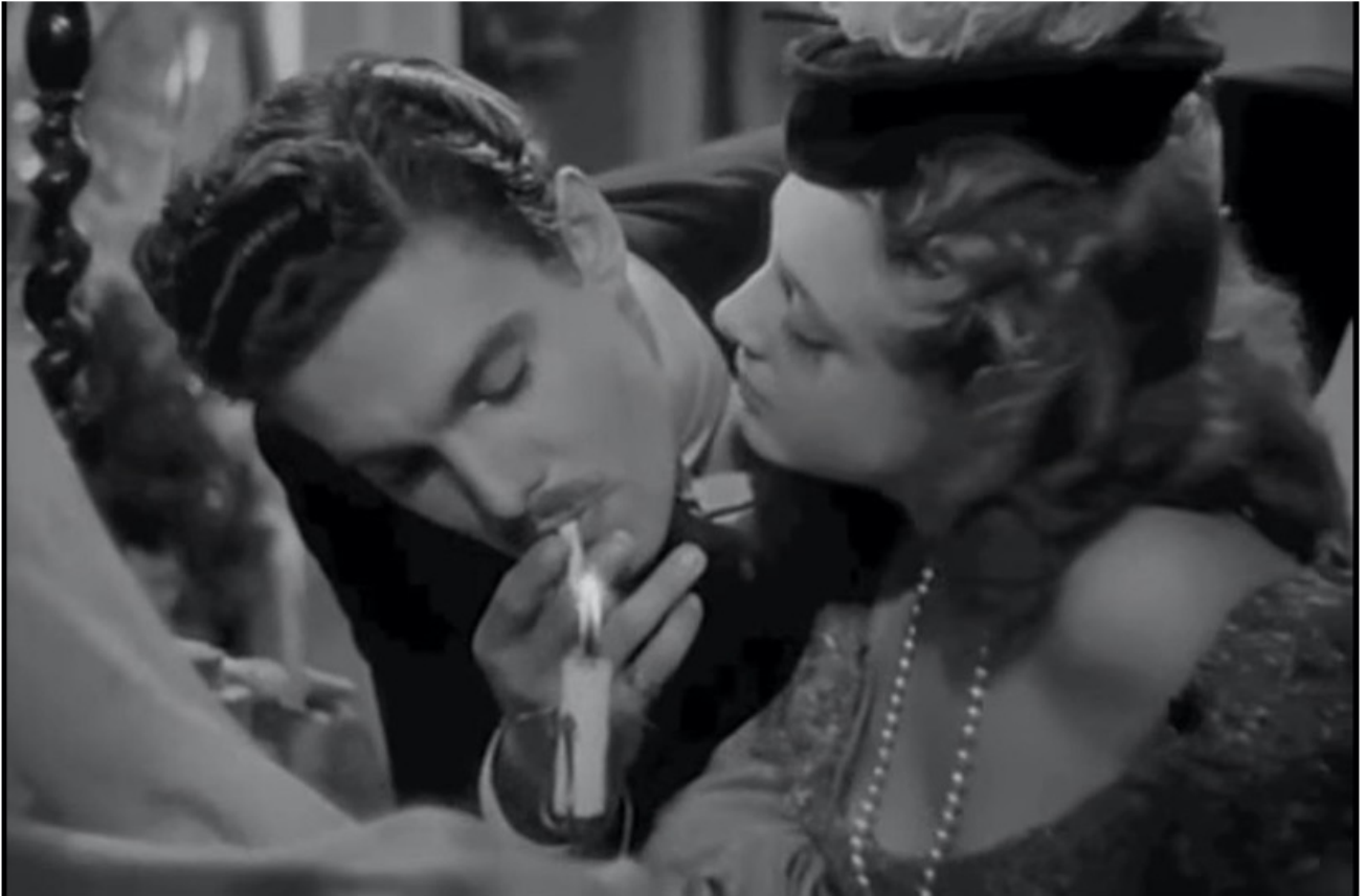
Félicie Nanteuil (1942), avec Micheline Presle.