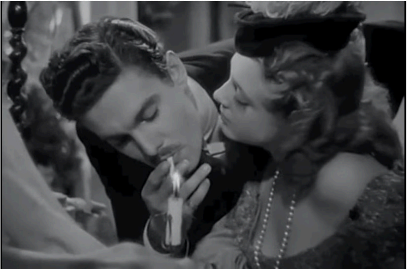
Félicie Nanteuil (1942), avec Micheline Presle.