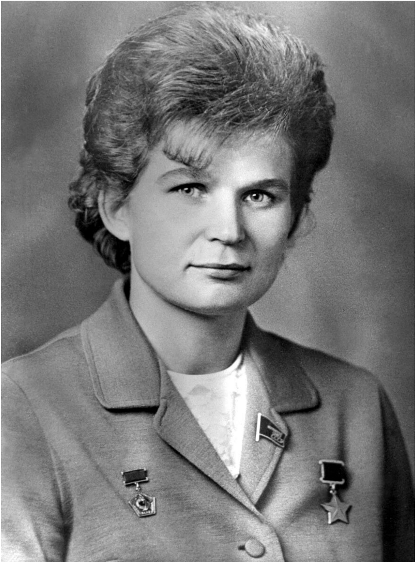
Valentina Terechkova

La sélection était plus difficile qu'avec les hommes. Si des