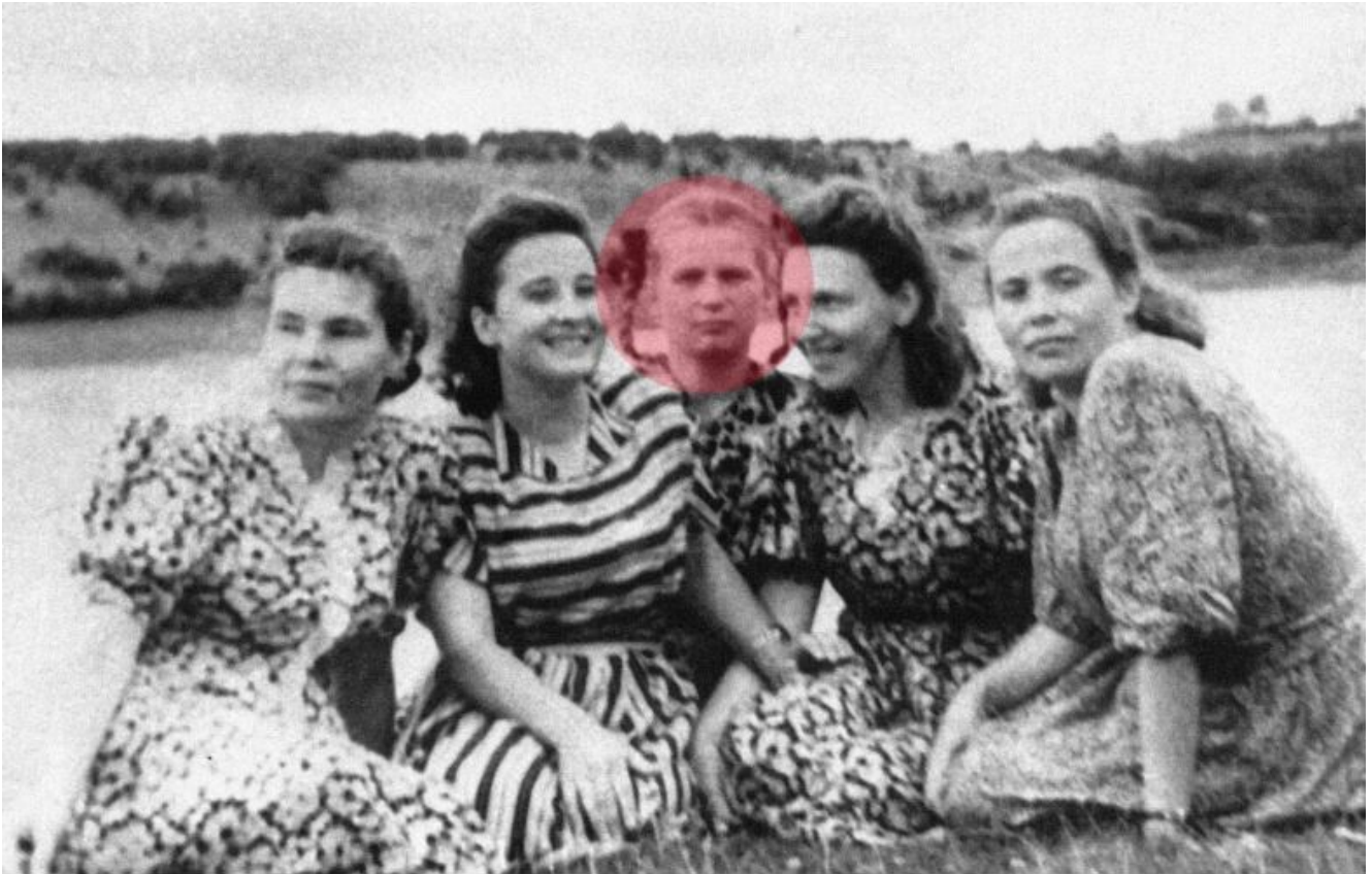
Valentina Terechkova (au centre)

candidats masculins étaient sélectionnés parmi les pilotes militaires, il y avait beaucoup moins de femmes pilotes en Union soviétique. Il fut décidé de chercher parmi les parachutistes. Exigences de base : moins de 30 ans, taille d'au plus 170 cm, poids de 70 kg maximum.