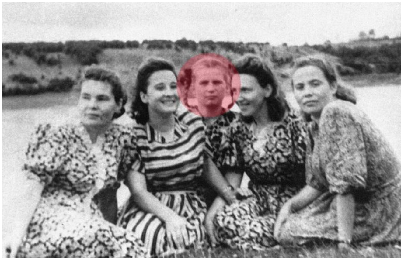
Valentina Terechkova (au centre)

candidats masculins étaient sélectionnés parmi les pilotes militaires, il y avait beaucoup moins de femmes pilotes en Union soviétique. Il fut décidé de chercher parmi les parachutistes. Exigences de base : moins de 30 ans, taille d'au plus 170 cm, poids de 70 kg maximum.