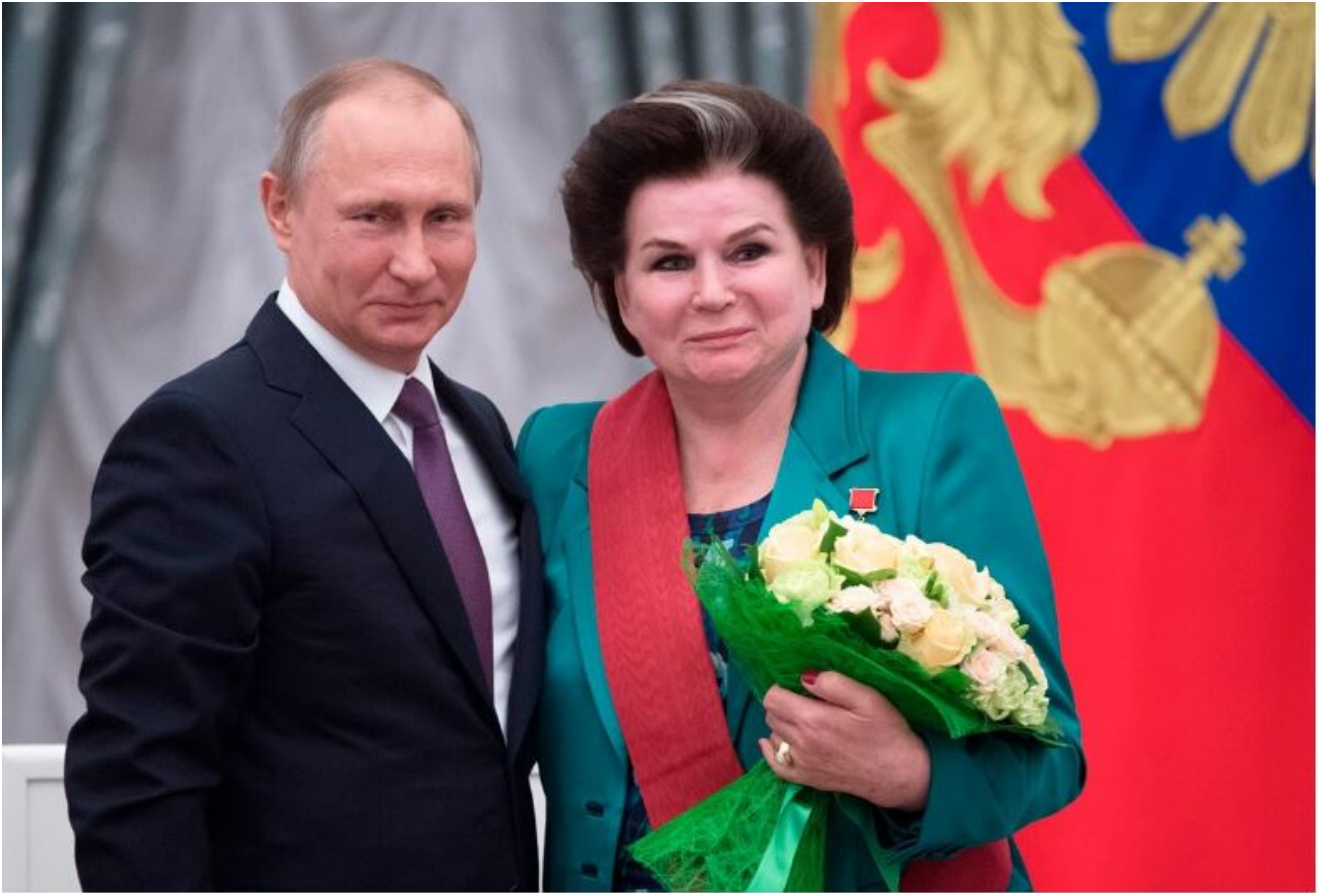
Vladimir Poutine et Valentina Terechkova

Le 6 mars, Valentina Terechkova a eu 85 ans. Elle est toujours un membre actif de la Douma d'État.