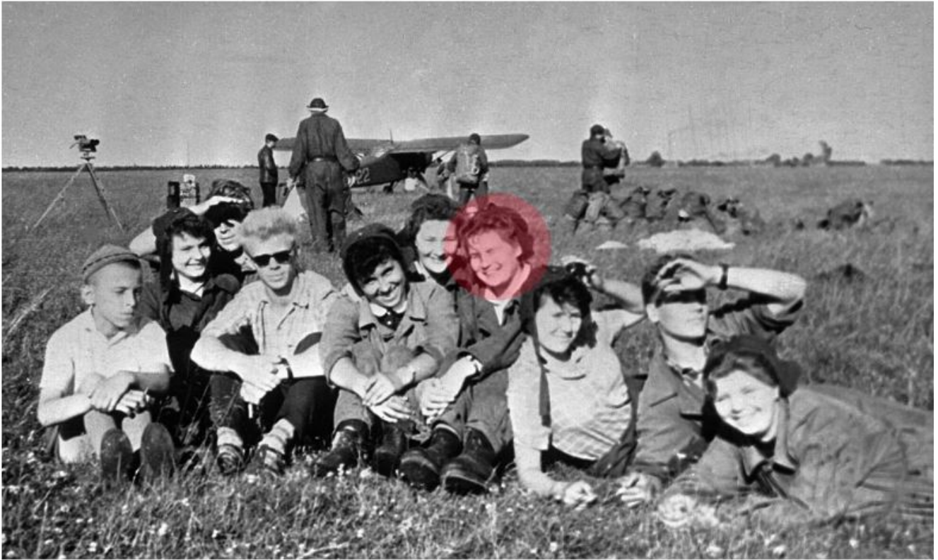
Membres de l'aéroclub de Iaroslavl, dont la future première femme cosmonaute Valentina Terechkova (quatrième à partir de la droite), 1961