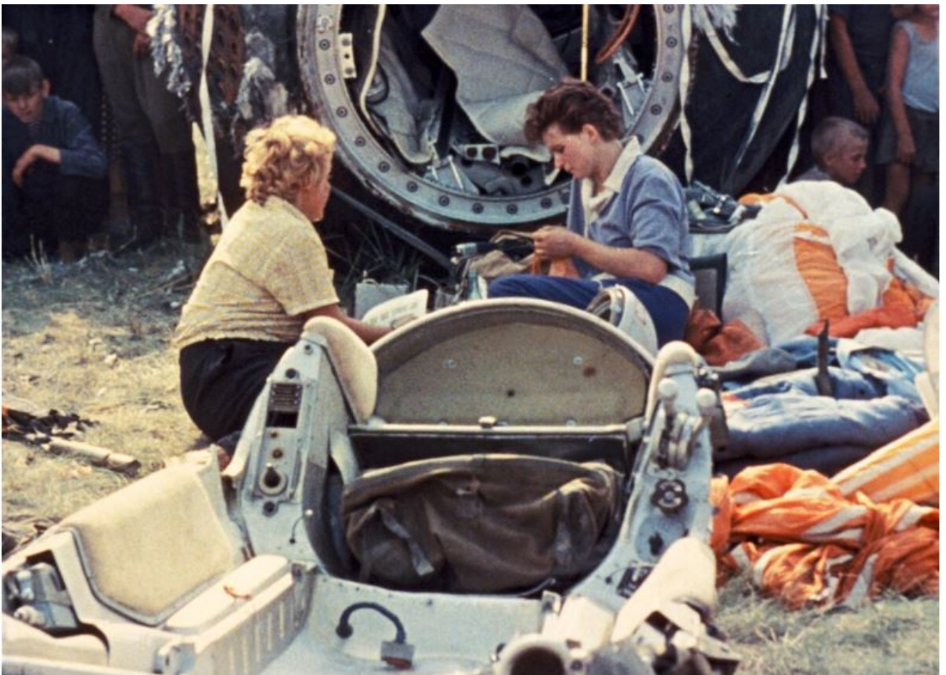
La cosmonaute Valentina Terechkova près du vaisseau soviétique Vostok 6 après l'atterrissage, juin 1963