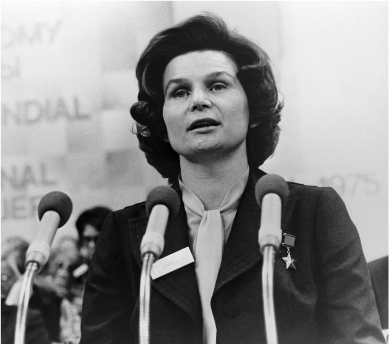
Terechkova au Congrès international des femmes, 1975