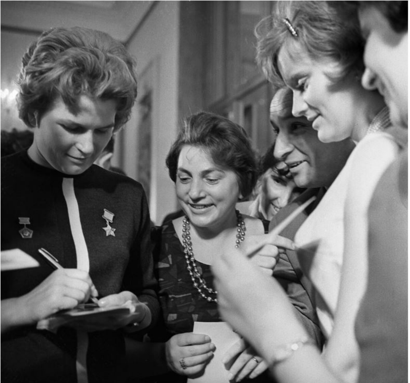
Valentina Terechkova lors d'une réception à l'ambassade de la République socialiste tchécoslovaque à Moscou, 1963