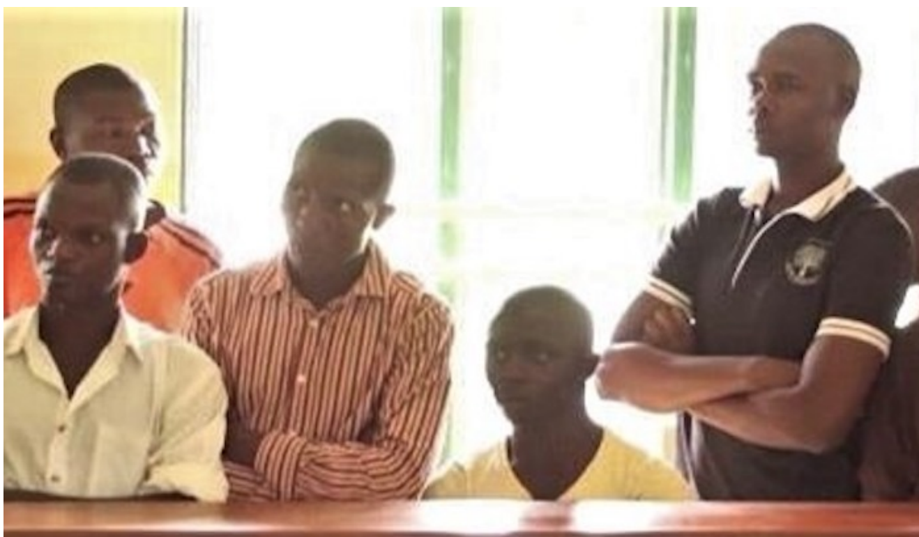
Photo : des chrétiens du district de Mukono, en Ouganda, regardent le juge prononcer le verdict pour le tueur de

Ouganda : une femme musulmane se convertit au christianisme, son père la tue le même jour.