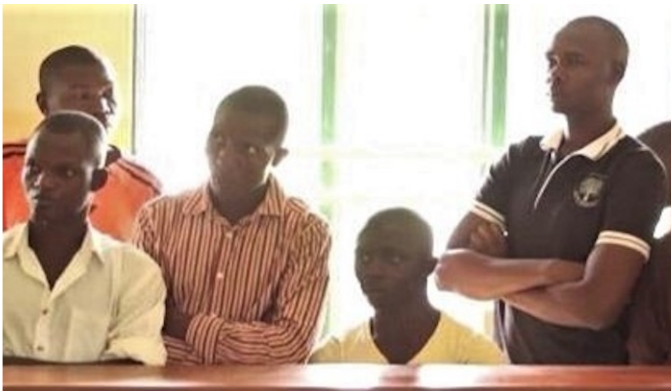
Photo : des chrétiens du district de Mukono, en Ouganda,

Ouganda : une femme musulmane se convertit au christianisme, son père la tue le même jour.