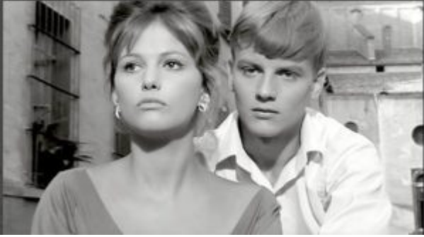
La Fille à la valise avec Claudia Cardinale, 1962