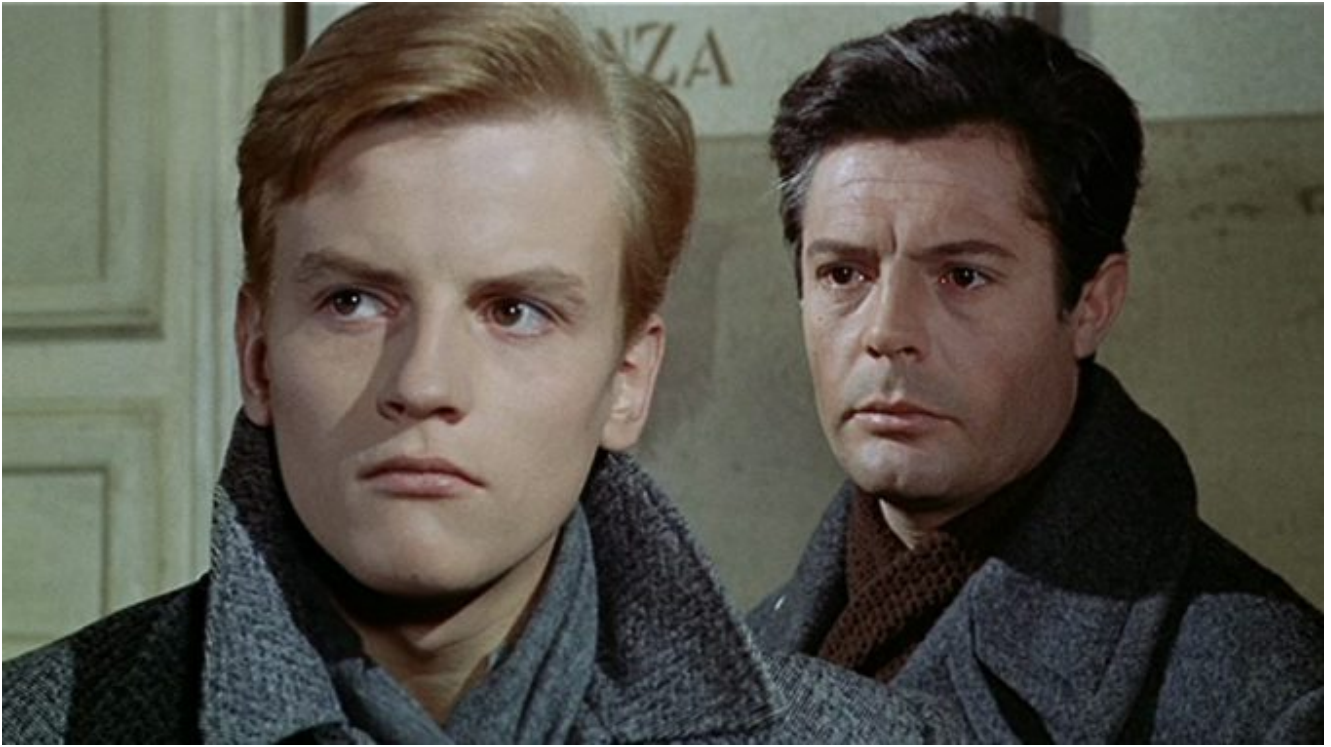
Jacques Perrin avec Marcello Mastroianni dans Journal intime, 1962

Passionné de documentaires , Jacques Perrin s'essaye également à la production et à la réalisation. En 1996, il produit le documentaire Microcosmos : Le peuple de l'herbe , pour lequel il reçoit le César du meilleur producteur .