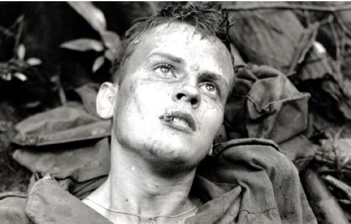
La 317e Section, 1963

En 1958, on l'aperçoit dans Les tricheurs de Marcel Carné. Deux ans plus tard, Jacques Perrin décroche un premier rôle dans La fille à la valise , et multiplie alors les apparitions. On le retrouve en particulier dans La Corruption , Les Demoiselles de Rochefort , Peau d'Âne ou plus récemment dans Les Choristes .