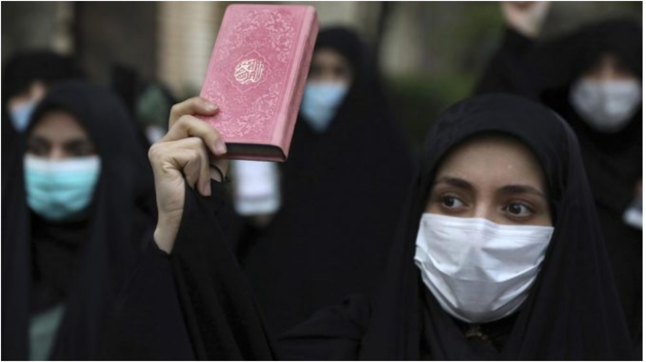
Des manifestants brandissent Coran, devant l'ambassade de Suède à Téhéran, lundi 18 avril 2022.