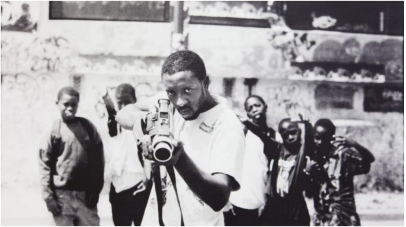
Les Misérables, film de Ladj Ly tourné à Montfermeil, version 2019