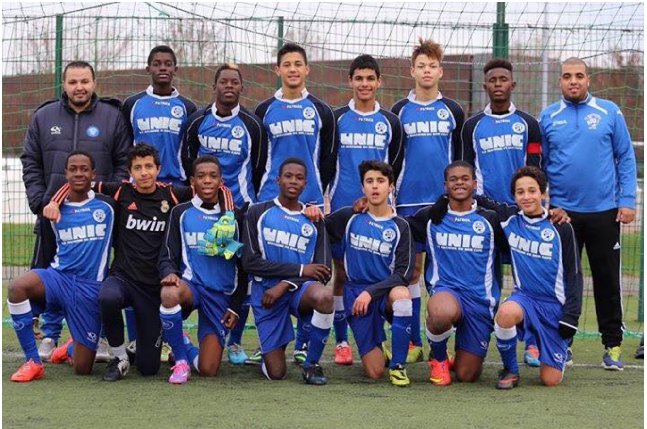
Les Misérables, film de Ladj Ly tourné à Montfermeil.