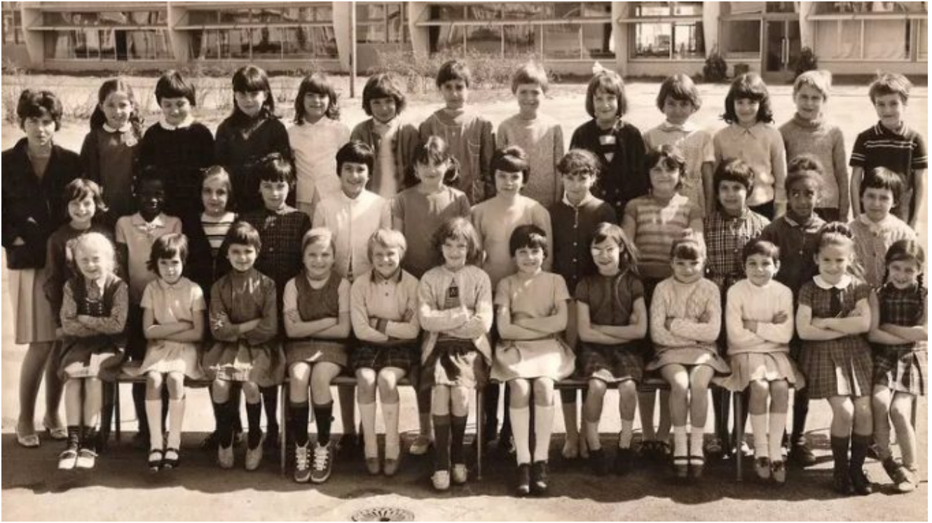
Photo de classe Ecole Victor Hugo – Montfermeil CE2 Année 66-67 de 1967, ECOLE VICTOR HUGO – Copains d'avant