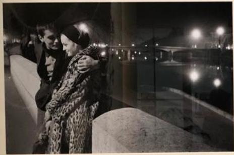
Richard D'AMICO Romy Schneider et Alain Delon sur les bords de la Seine 12 Mars 1967 Trague Photographie 2002 © Alain Delon/AGF/Contrasto « Pourquoi s'embrassent-ils ? C'est tout simple. Comme les amoureux, à la veille de leur mariage. C'est ainsi que sont nées les plus belles amitiés de mon époque. Non ? C'est certainement les plus belles amitiés de mon époque. C'est certainement de mon époque. C'est certainement de mon époque. C'est certainement de mon époque. »