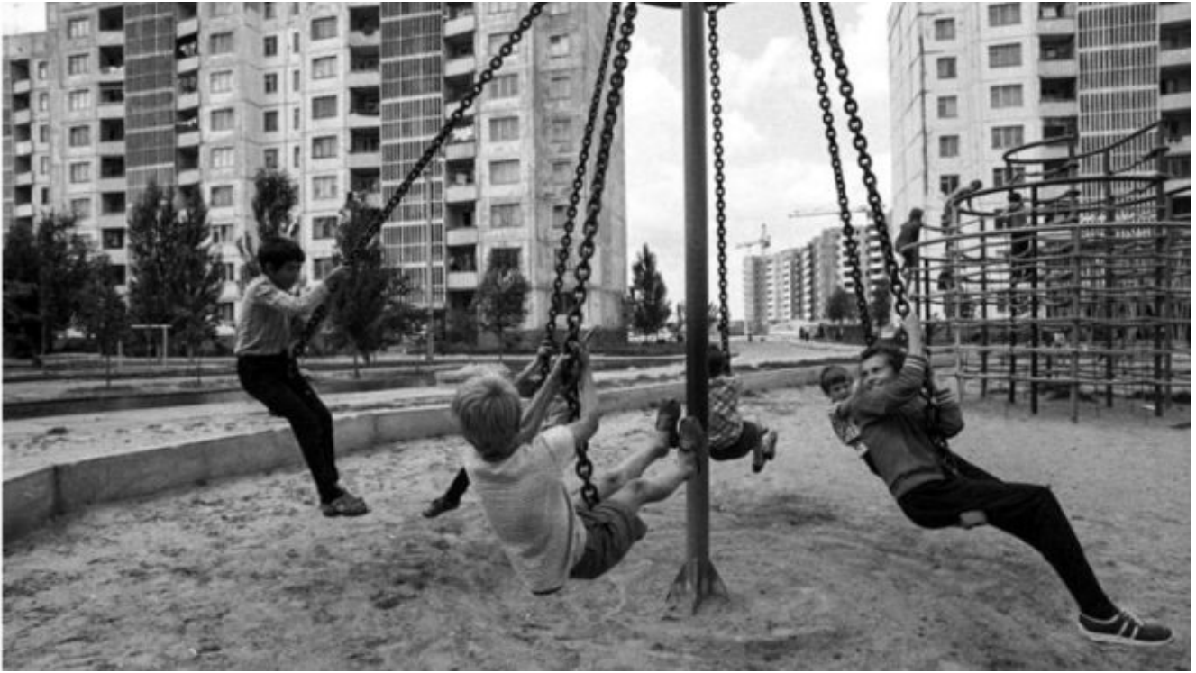
Illustration : enfants russes, ère soviétique, Russia behind , culture russe.

Sharafmal a tenu ces propos ignobles lors d'une émission sur la chaîne d'information Channel 24.