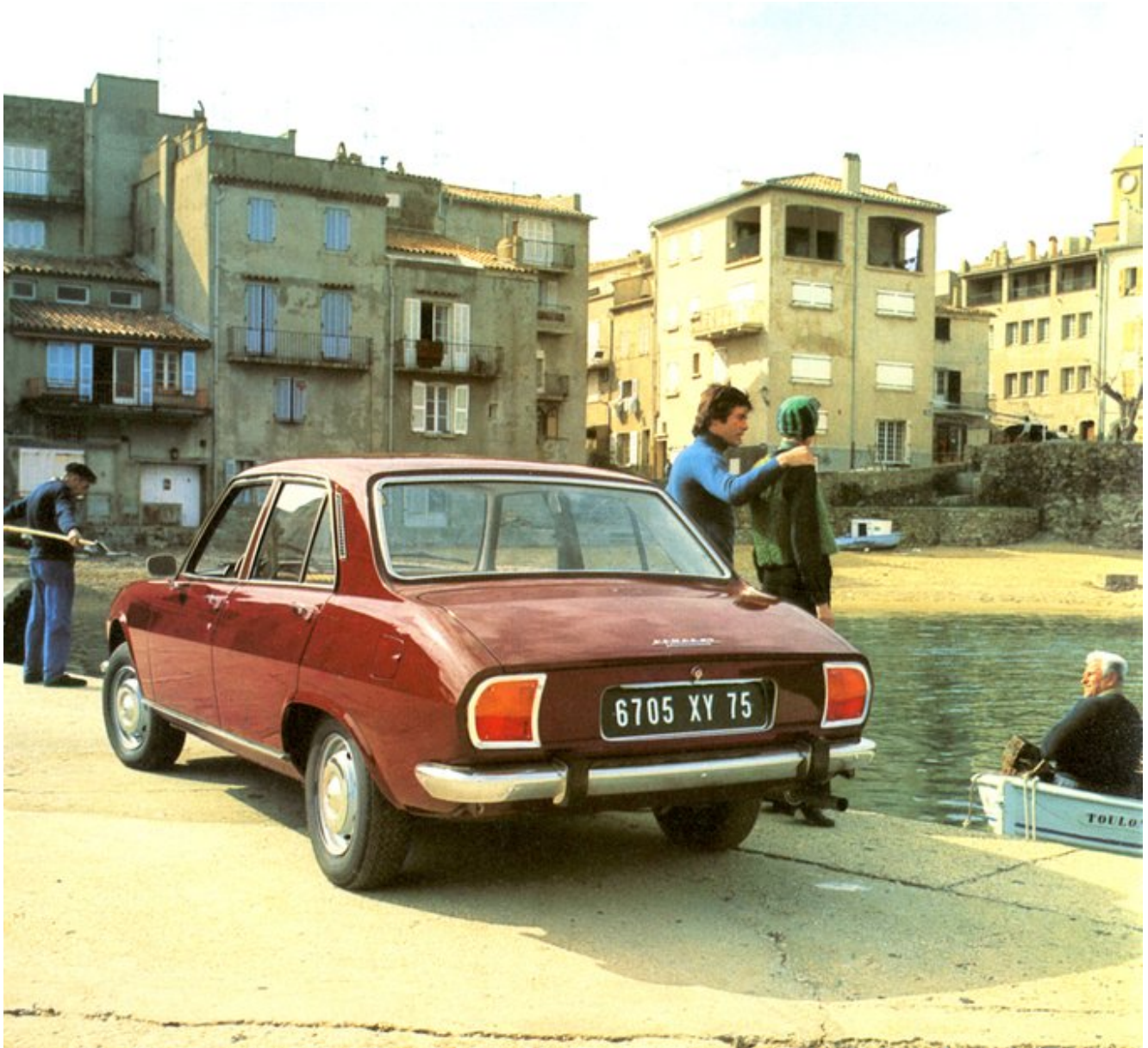
La 504 PEUGEOT Des parisiens en vacances à St Tropez 1983 Le vieux port de l'autre côté

– □ Alésia Regnald □□ □□□□□□□□□□□□□□□□ ( @wiccant_ March 8, 2022 )