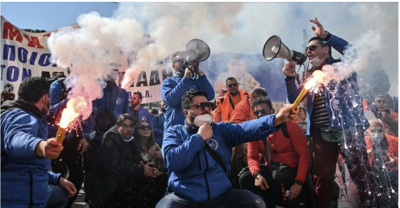
Manifestants contre l'inflation à Athènes, en Grèce, le 26 février 2022.

En Grèce, au moins 10 000 personnes se sont réunies devant le Parlement d'Athènes ce week-end à l'appel des syndicats, pour dénoncer l'inflation galopante, en particulier dans le secteur de l'énergie. Dans un pays toujours marqué par de bas salaires hérités de la crise économique, une inflation trop importante pourrait en effet menacer de nombreux Grecs de pauvreté.