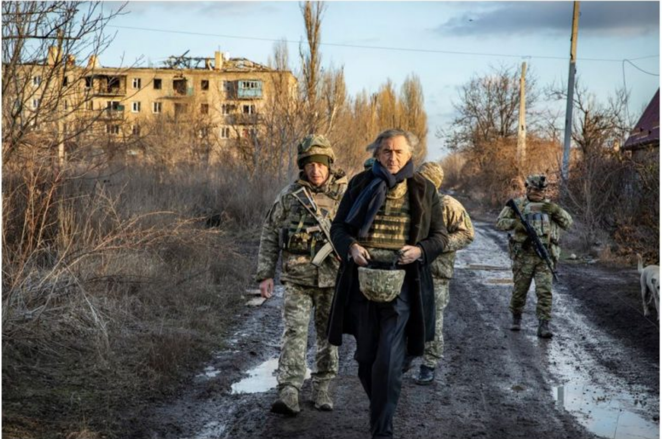
A Piesky, le 26 janvier 2020.

écrit par François des Groux | 25 février 2022