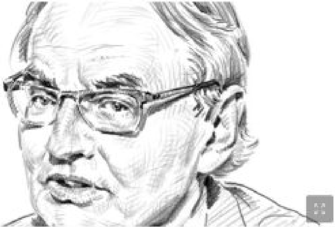
Jean-Louis Bourlanges, juge qu'il faut « parler à Poutine », dans la mesure où il s'y prête, FC

ENTRETIEN – À l'égard de l'Ukraine, l'objectif géopolitique de Poutine s'accompagne d'un objectif idéologique: empêcher la contagion du modèle démocratique occidental [...]