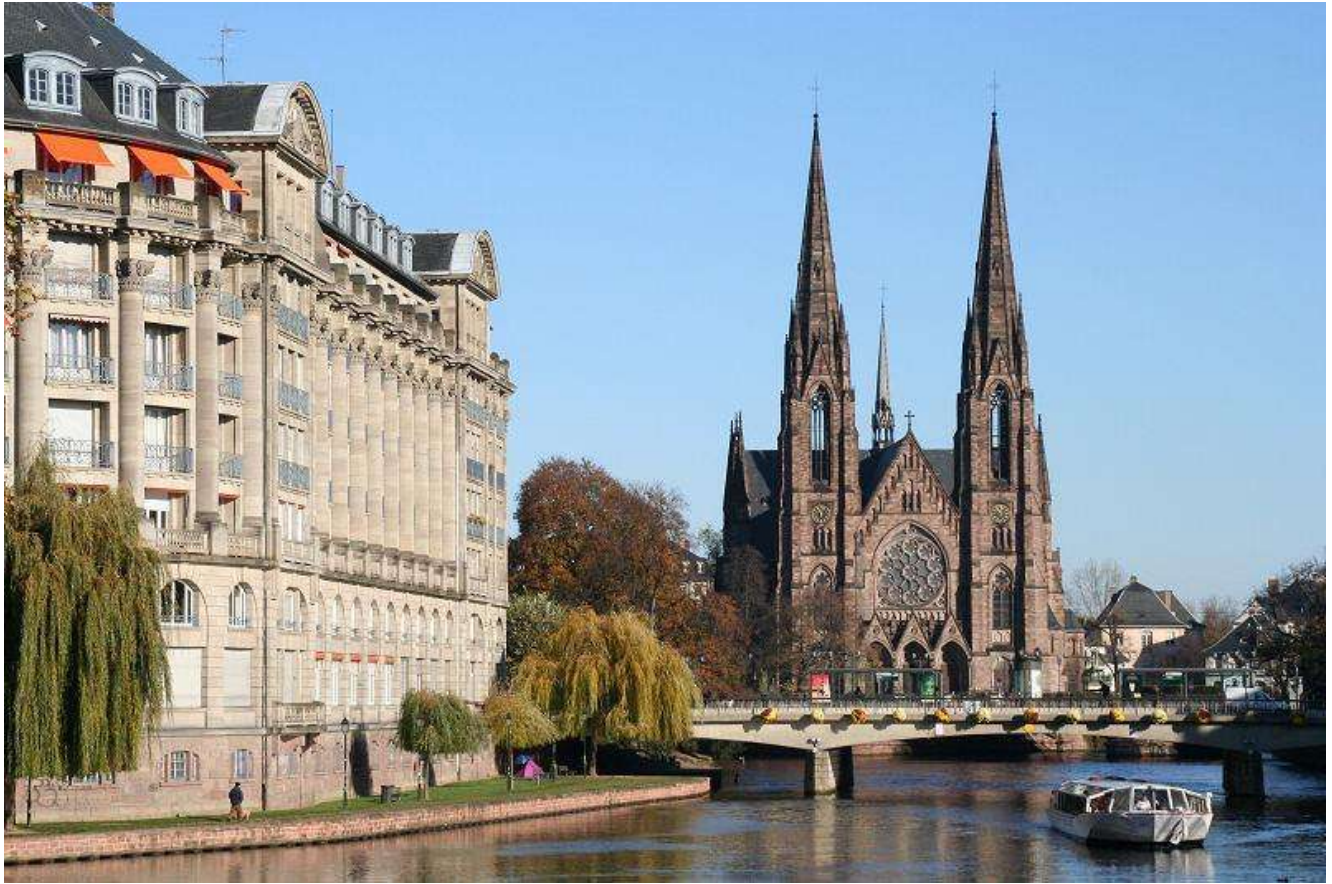
Eglise Saint-Paul, Strasbourg