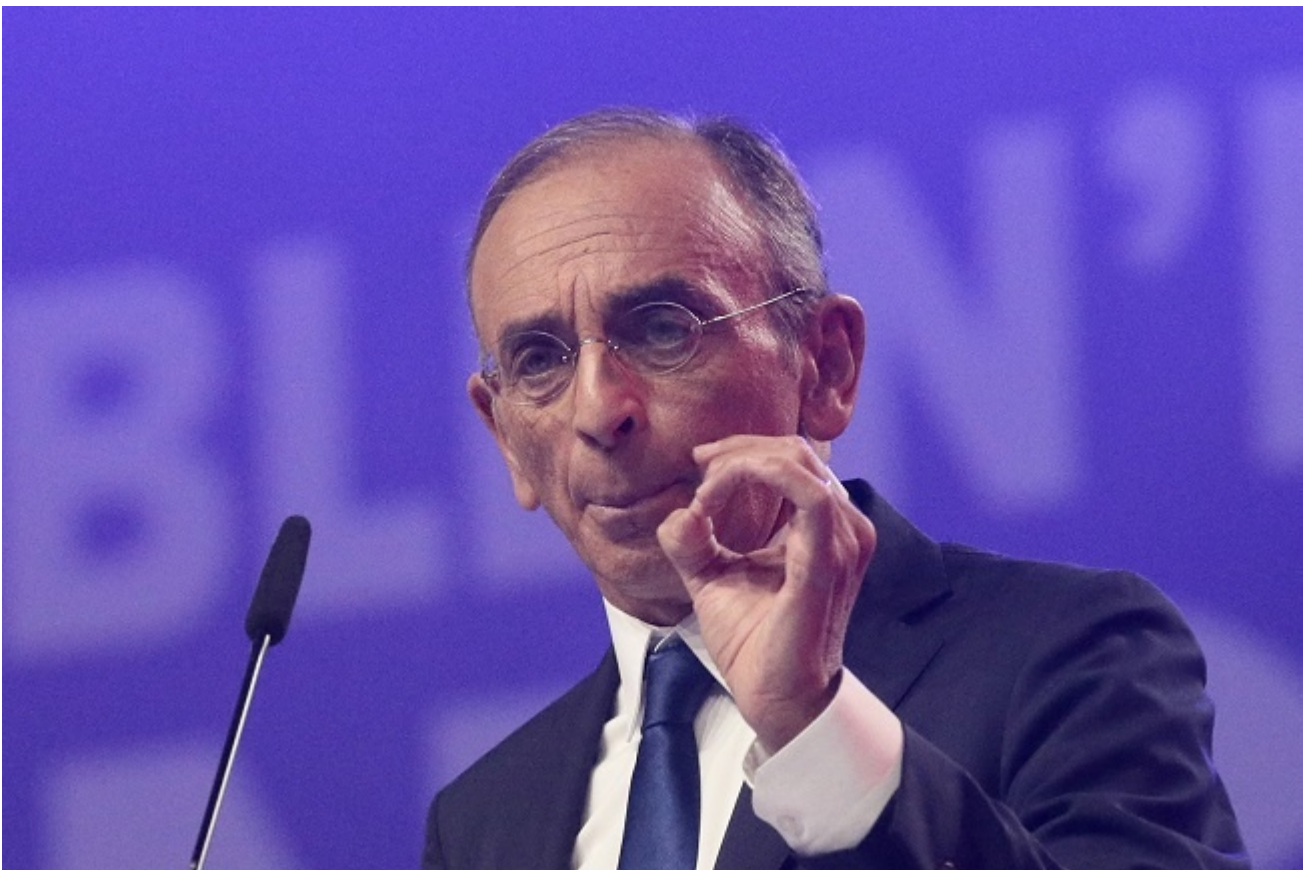
Éric Zemmour a répondu aux questions d'une vingtaine de