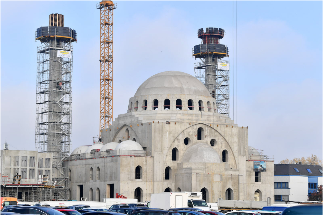
Strasbourg : le chantier de la mosquée Eyyub-Sultan avance