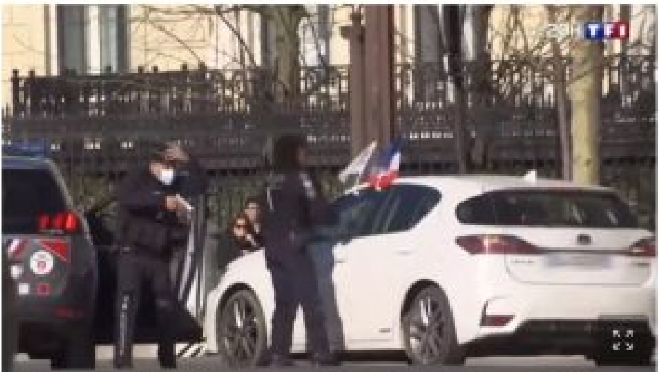
La préfecture de police de Paris annonce l'ouverture d'une enquête administrative après la diffusion d'un reportage de TF1.

«Convois de la liberté» à Paris : enquête administrative ouverte après une intervention policière place de l'Étoile