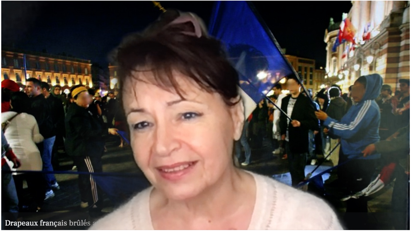
Drapeaux français brûlés