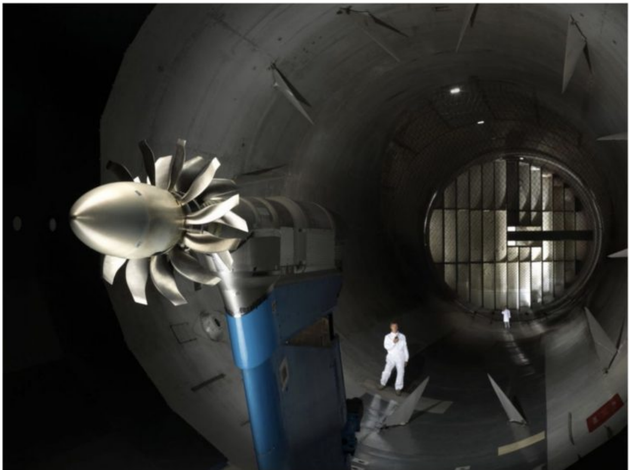
TEST D'UN MOTEUR OPEN ROTOR DE SAFRAN DANS LA SOUFFLERIE ONERA DE MODANE (SAVOIE)

Le laboratoire de recherche aérospatiale, en pointe sur les projets d'avion vert, de missiles hypersoniques ou de surveillance spatiale, est soumis à une cure d'austérité difficilement compréhensible. Les syndicats dénoncent un décrochage par rapport au DLR allemand, aux moyens en forte hausse.