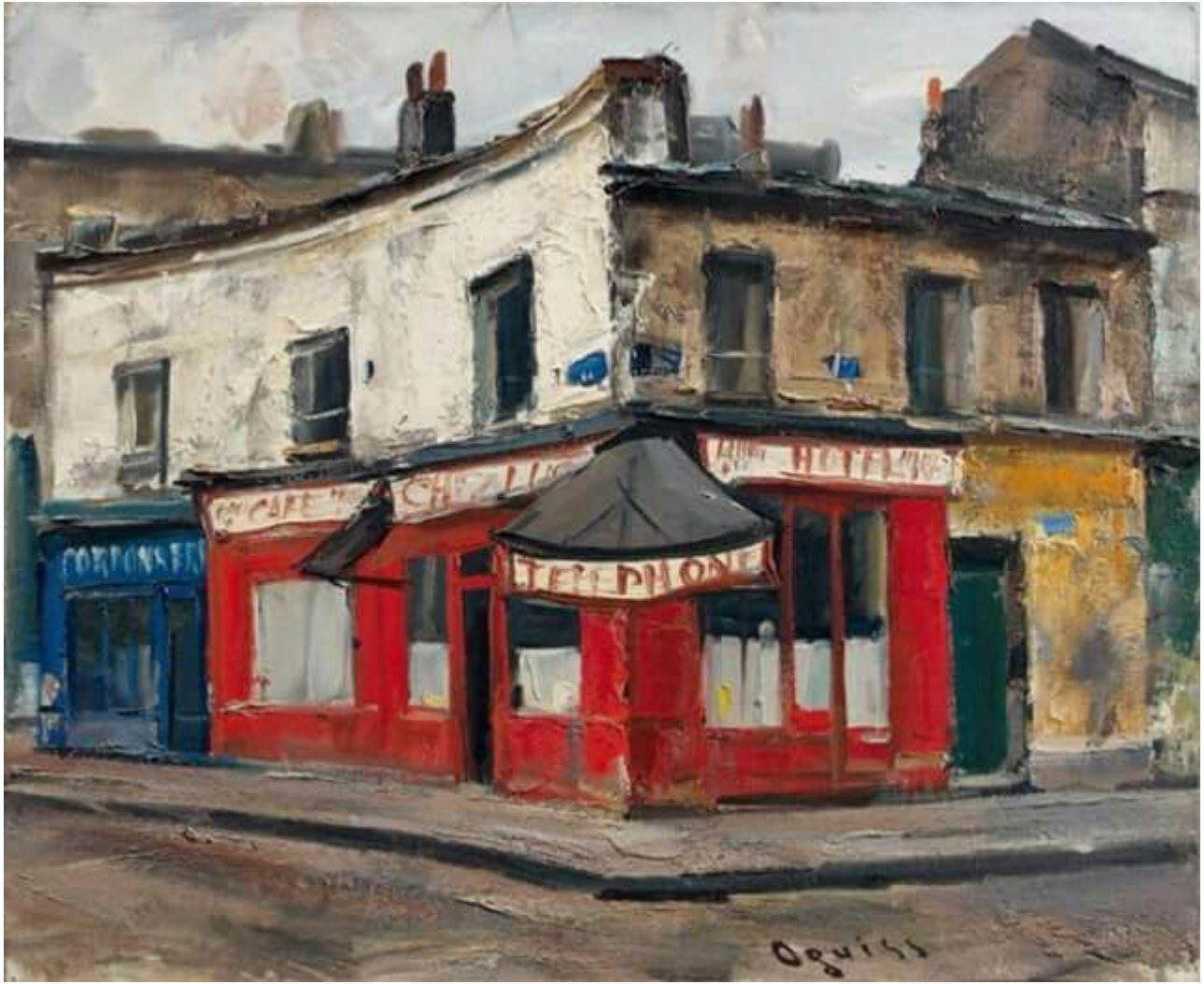
Takanori Oguiss Café Chez Lucien