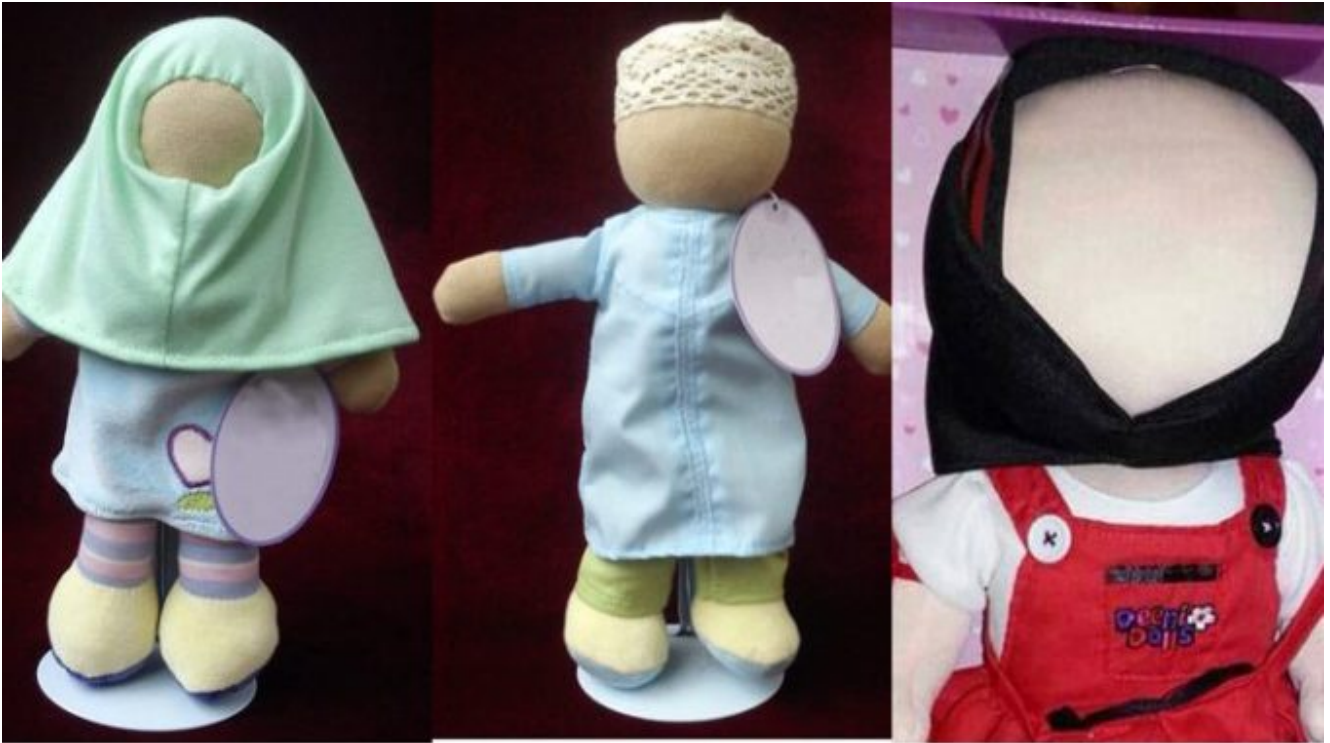
Illustration : poupées vendues au Royaume Uni, conçues pour être strictement compatibles avec les préceptes de l'islam

https://twitter.com/M6/status/1484571492985806855?ref_src=twsrc%5Etfw%7Ctwcamp%5Etweetembed%7Ctwterm%5E1484571492985806855%7Ctwgr%5E%7Ctwcon%5Es1_c10&ref_url=https%3A%2F%2Fwww.ladepeche.fr%2F2022%2F01%2F24%2Fzone-interdite-a-roubaix-que-signifient-ces-poupees-sans-visage-qui-ont-fait-polemique-10065489.php