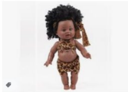
Poupées AUCUNE 35 cm fille africaine po... darty.com · En stock