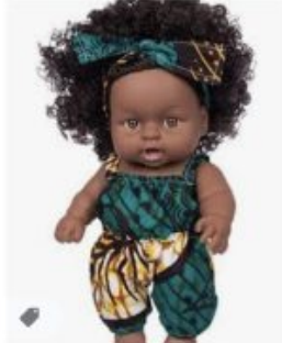
Poupée Africaine Curly ... amazon.fr