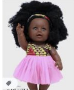
Poupée noire "Linguère... gdustyl.shop · En stock