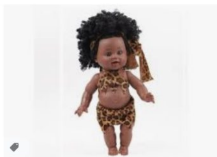
Poupées AUCUNE 35 cm fille africaine po... darty.com · En stock