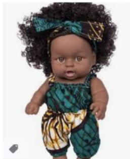
Poupée Africaine Curly ... amazon.fr