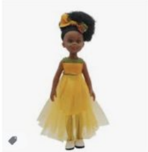
Ravissante poupée noire de ... kitoko-doll.com · En stock

written by François des Groux | 20 janvier 2022