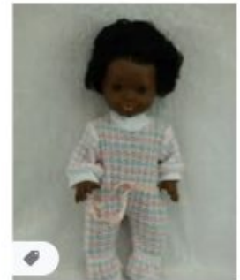
VINTAGE POUPEE NOI... ebay.fr · En stock