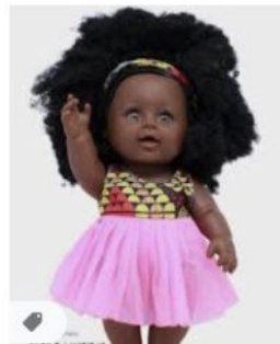
Poupée noire "Linguère... gdustyl.shop · En stock