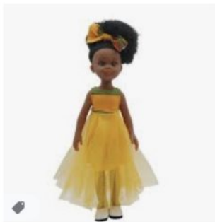
Ravissante poupée noire de ... kitoko-doll.com · En stock