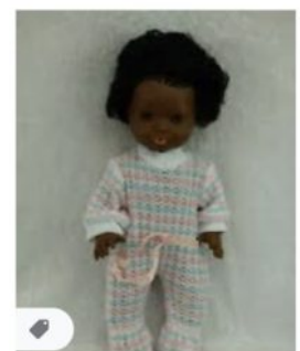
VINTAGE POUPEE NOI... ebay.fr · En stock