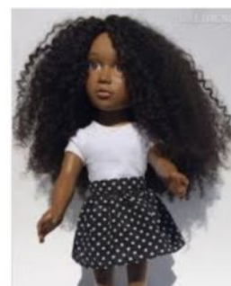
Angelica Doll : une pou... puretrend.com