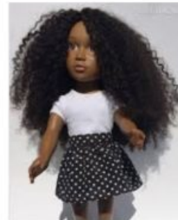
Angelica Doll : une pou... puretrend.com