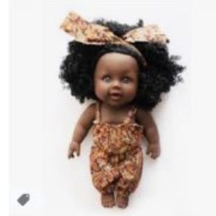
Poupée Noire en Tissu | Ilov... ilovemyafrica.com · En stock