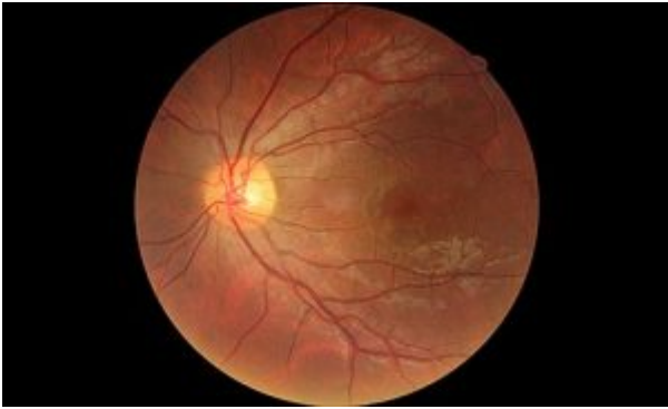
Photographie du fond d'œil avec CRSC