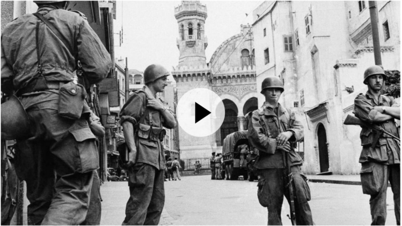
Les troupes françaises dans le quartier de la casbah d'Alger, 27 mai 1956

MACRON IRRESPONSABLE pour avoir transféré -avec quinze ans d'avance- toutes nos archives à l'Algérie du FLN, sans que celle-ci n'ouvre les siennes, transférant ainsi, notamment, tous nos dossiers d'enquêtes judiciaires et policières, ceci sans demande de réciprocité, ni garantie de confidentialité, les livrant ainsi sans état d'âme aux éventuelles vengeances de fous furieux.