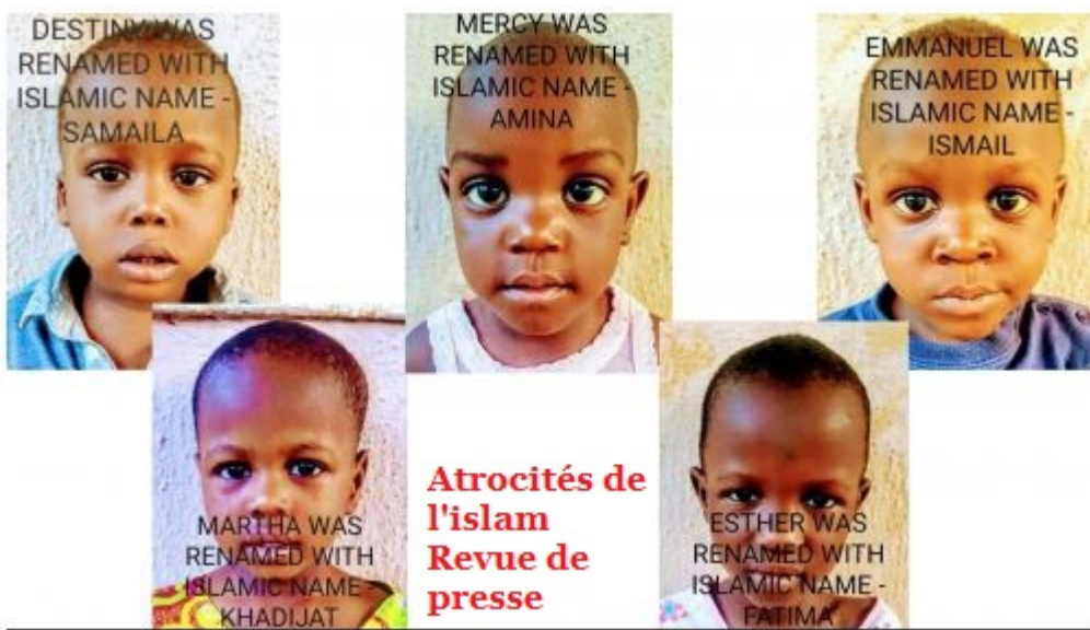
Illustration : quelques-uns des garçons arrachés à l'orphelinat chrétien par le gouvernement musulman... le jour de Noël 2019.

On leur a attribué des prénoms musulmans !