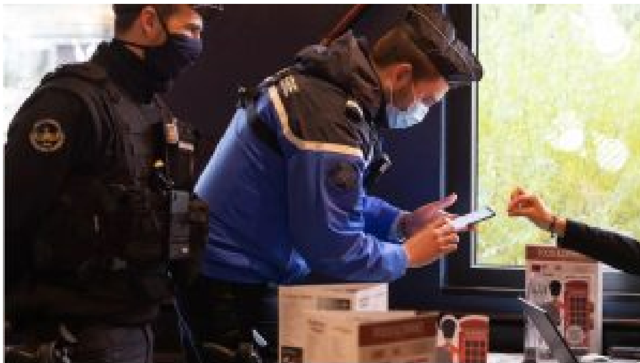
Le passe vaccinal devrait remplacer le passe sanitaire pour accéder aux lieux de loisirs, comme les bars et restaurants.

A bientôt trois mois de l'élection présidentielle, le sujet a bien sûr pris une tournure politique. Alors que le projet de loi sur le passe vaccinal était présenté lundi en Conseil des ministres, les candidats de droite comme de gauche se sont