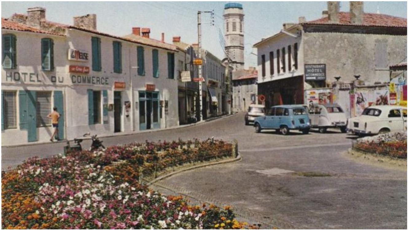
SAINTE PIERRE D'OLERON PLACE DE LA MAIRIE. VUE SUR LE CLOCHER