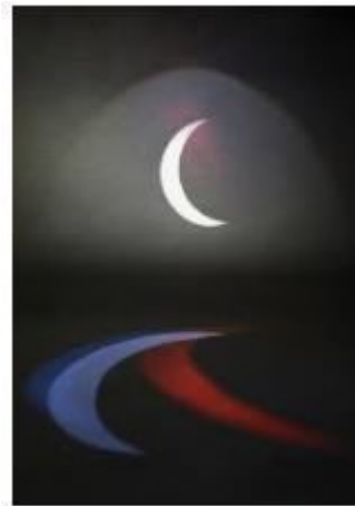
Faites confiance à l'islam... liberation.fr