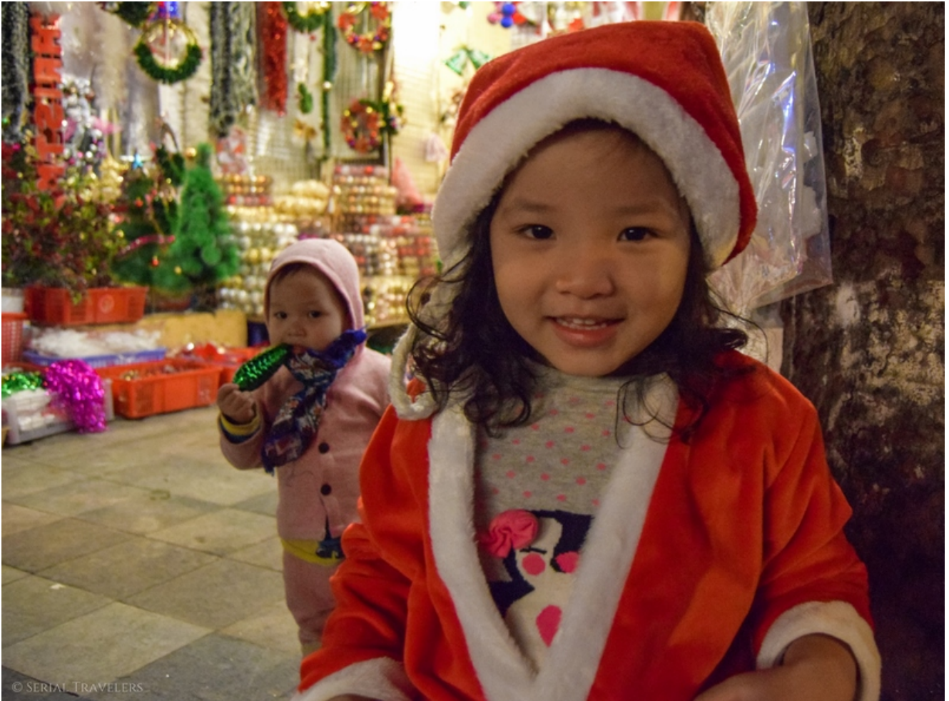
Illustration : Noël à Hanoï

Les autorités sanitaires du sud-est du Vietnam ont suspendu l'utilisation du vaccin COVID-19 de Pfizer-BioNTech, également connu sous le nom de BNT162b2 ou Comirnaty, après que plus de 120 enfants ont été hospitalisés après une vaccination de groupe à l'école.