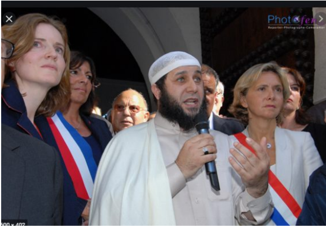
Entre l'Ile de France et Alger...