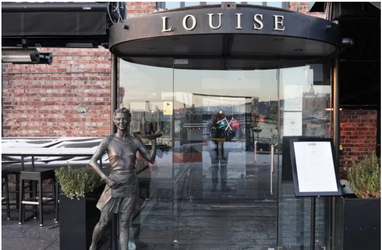
Le restaurant qui accueille la soirée à Oslo (Norvège), le 2 décembre 2021.

Panique en Norvège où un énoooooorme foyer de dangereux infectés au terrible variant Omicron oblige le gouvernement norvégien à prendre des mesures drastiques pour éviter des millions de morts.