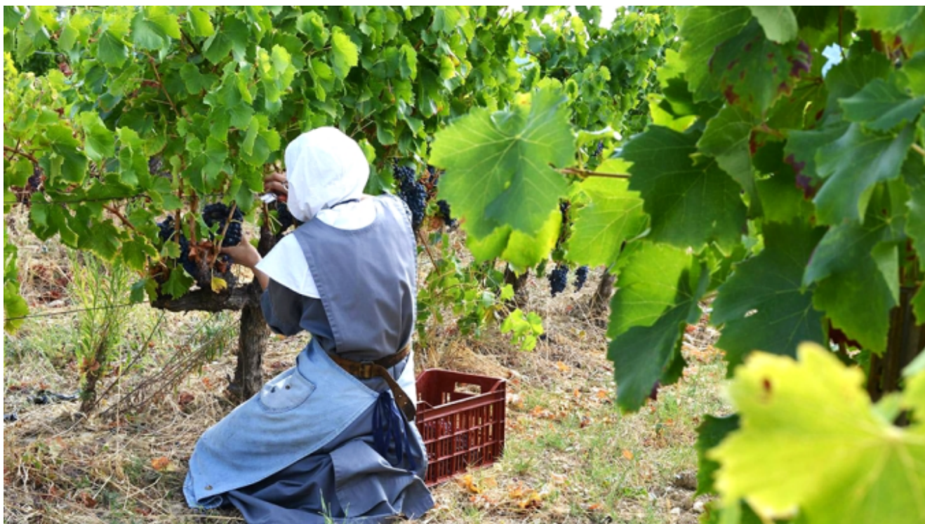
Les soeurs participent aux vendanges pour le vin de l'abbaye du Barroux

Benoît, elles vivent cloîtrées, donc retirées du monde. Leurs journées sont rythmées par la prière et le travail. C'est donc sept offices quotidiens que les sœurs chantent, le premier étant à 5h... Plutôt très matinales ces moniales ! Sinon, le reste de leur temps, elles le consacrent à divers travaux, aussi bien pour la vie quotidienne du monastère (infirmerie, cuisine, sacristie, etc.), que pour leurs différents "emplois" et leur vaste domaine. En fait, elles ont même un nombre impressionnant d'ateliers : celui des confitures, du nougat, des éditions, de reliure, de cordonnerie, de menuiserie, de confection de vêtements d'enfants, de tissage d'ornements liturgiques en soie : tout y est ! Côté champs, elles cultivent aussi des vignes (qui participent aux vins de l'abbaye du Barroux ), du lavandin, des figues, des olives, des amandes, des abricots, et d'autres encore. En somme, ça sent bon la Provence chez les bénédictines du Barroux !