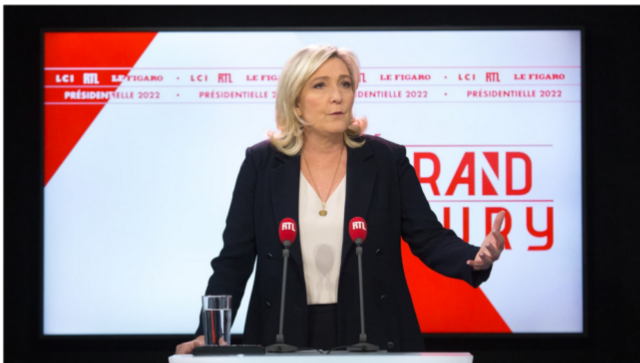
Marine Le Pen, invité du Grand Jury chez nos confrères de RTL-Le Figaro-LCI dimanche 28 novembre 2021

La cote de Marine Le Pen monte, celle d'Eric Zemmour baisse.