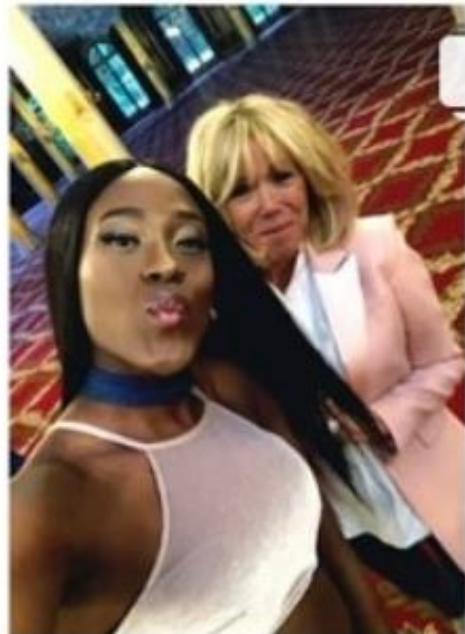
... avec des transfolles à l'Elysée, « fils d'immigrés, noirs et pédés »