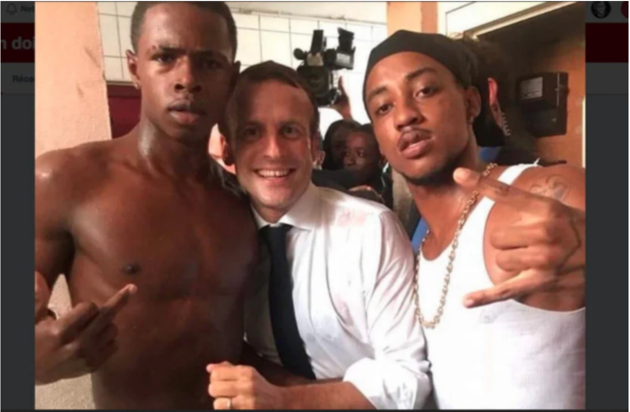
Macron et ses potes délinquants aux Antilles ou bien...