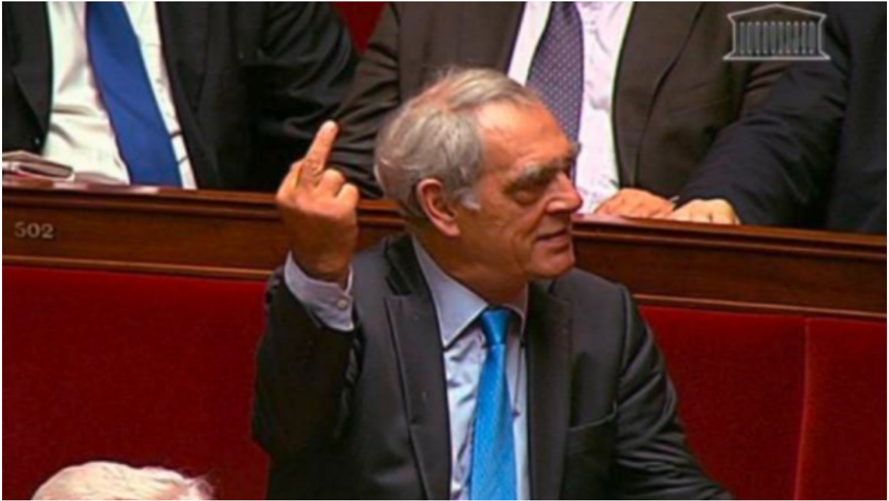
Le doigt d'honneur d'Emmanuel à Fillon...