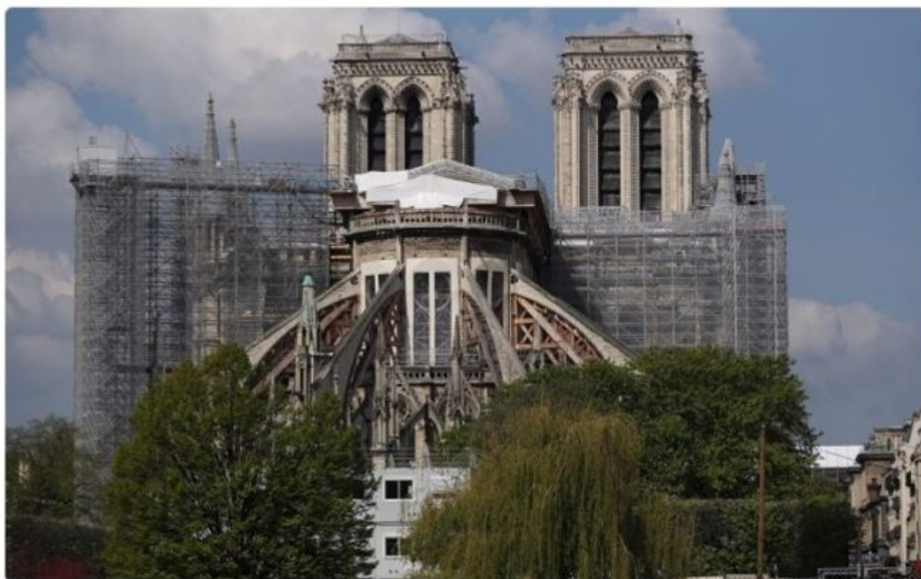
Des architectes qui ont consulté les plans de la cathédrale, ravagée par un incendie en 2019, décrivent des rénovations aberrantes.

Dans les colonnes du Telegraph, des architectes qui ont consulté les plans de la cathédrale, ravagée par un incendie en 2019, décrivent des rénovations aberrantes, comme “un sentier de la découverte” et des expositions “le christianisme pour les nuls”.