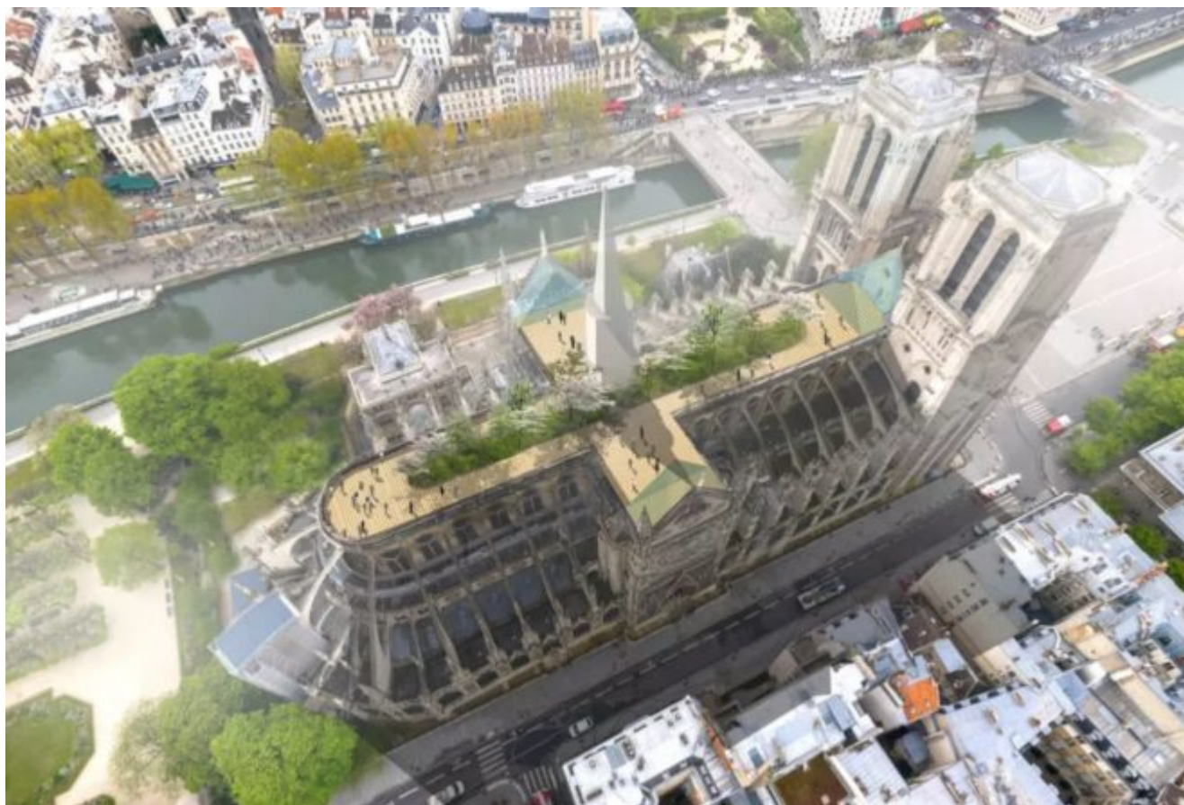
Studio Fuksas : une toiture lumineuse nuit et jour