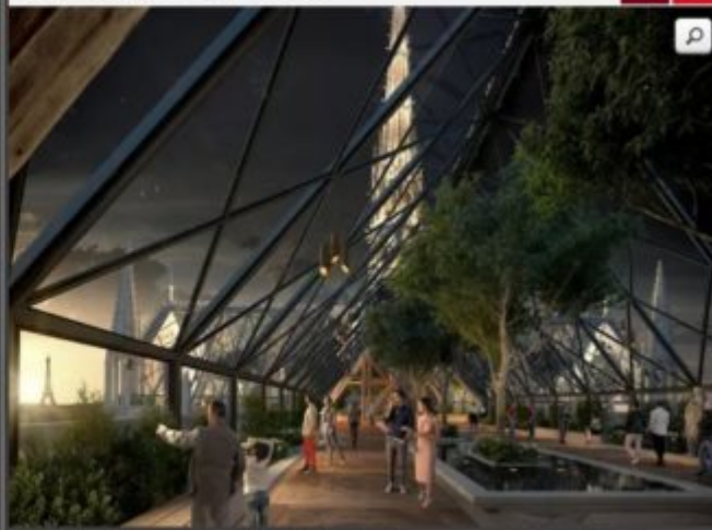
Miysis : forêt suspendue

L'intérieur de la verrière serait végétalisé en hommage au surnom de l'ancienne toiture de Notre-Dame, "la Forêt", dont certaines poutres remontaient au 12e siècle.