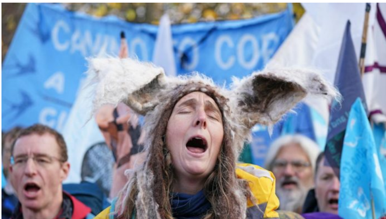
Photo : des groupes de pèlerins arrivent à Glasgow alors que les manifestations démarrent avant la Cop26

Le milliardaire qui culpabilise les populations à longueur d'année entend bien continuer à vivre sans limites !