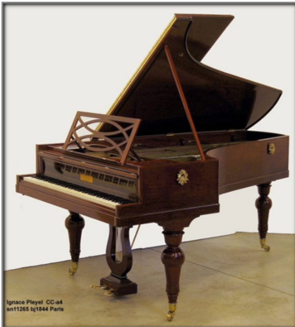
Un des pianos de Chopin, un Pleyel

Alors, maintenant, les surprises, c'est quoi ? Et bien, elles sont ENORMES !!