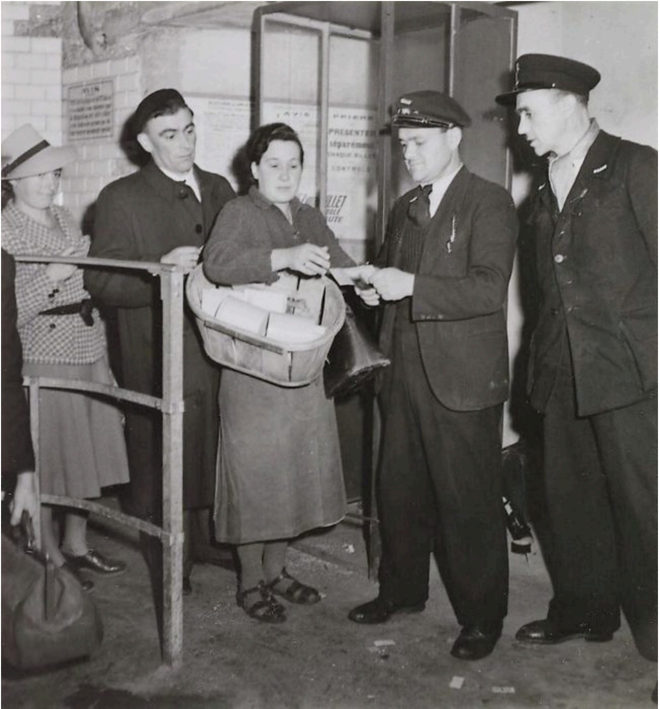
1941 Le poinçonneur du métro, station Les Halles

Tarif I : 4 août 1941 « rationnement sur le papier »