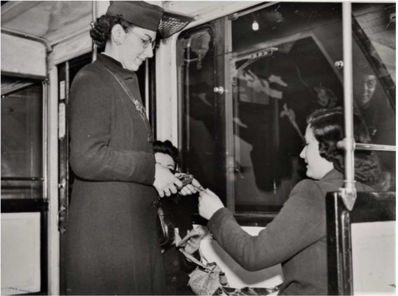
Métro parisien, contrôle des billets en 1ère classe, 1943