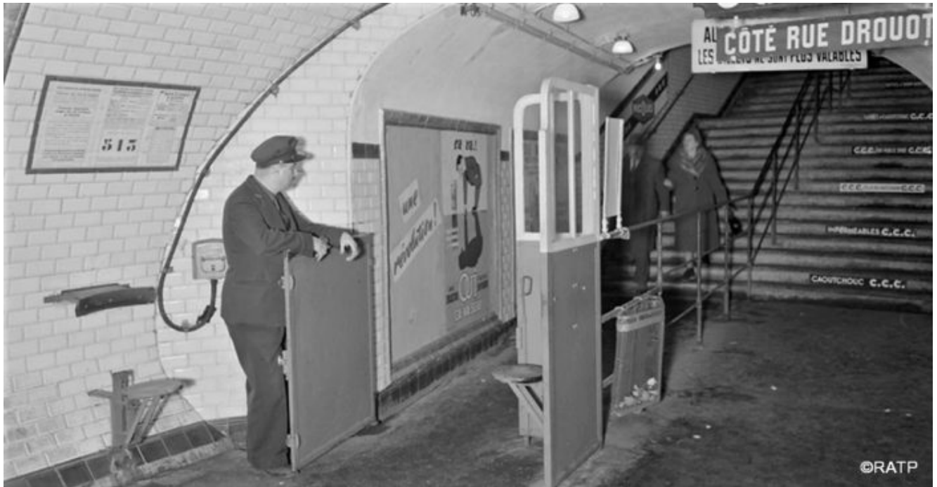
1963 Station Richelieu-Drouot

... quand il n'attendait pas derrière les portes qui obstruaient les quais.