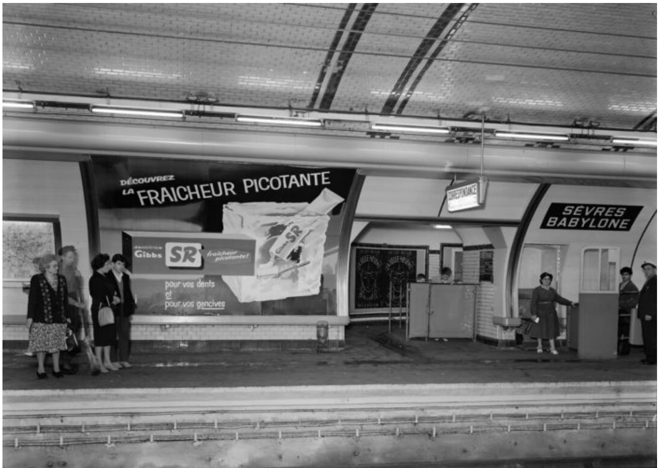
1960 Métro Sèvres Babylone – Paris avant le Grand Remplacement