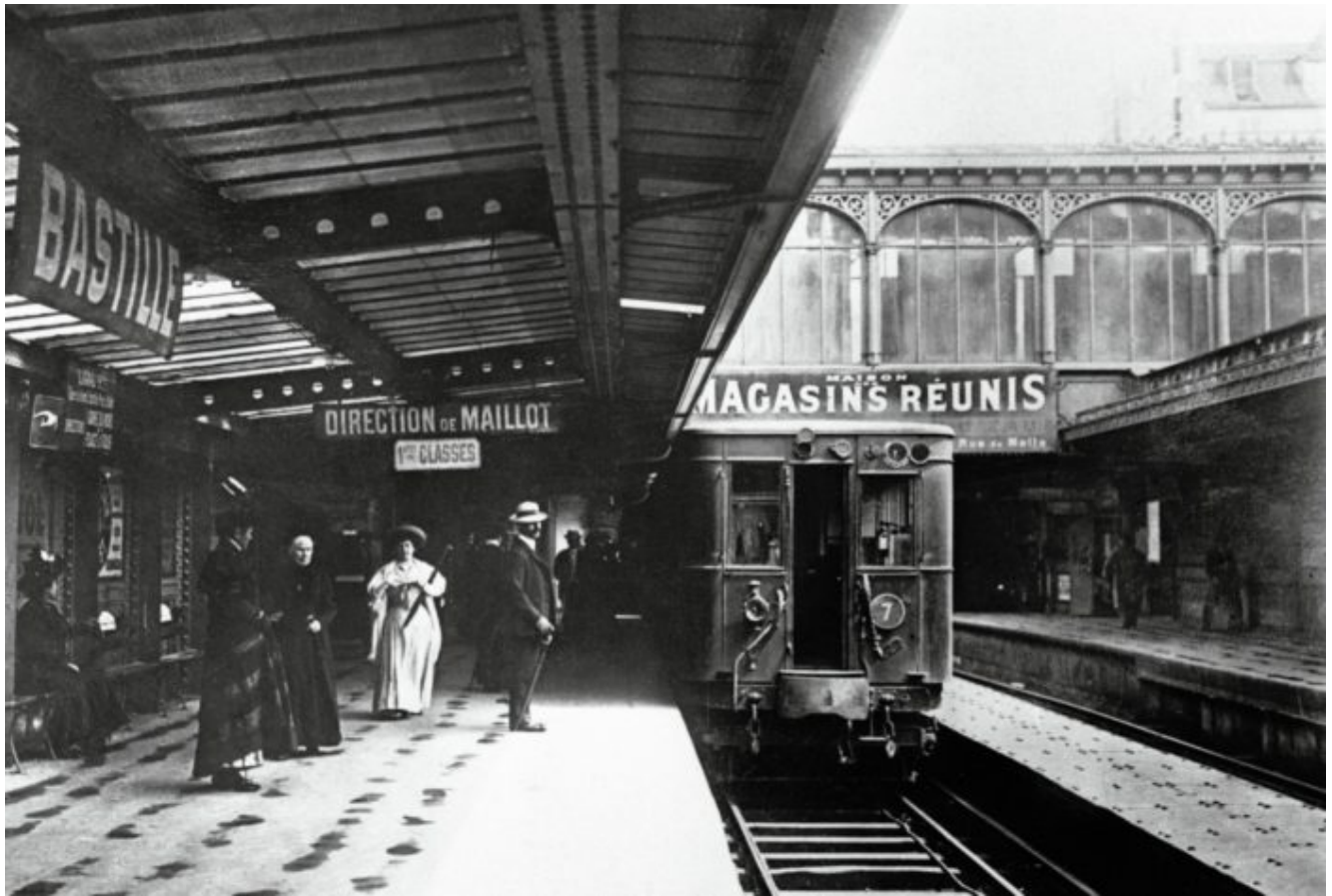
Station Bastille. Au vu du matériel roulant, cette photo pourrait dater d'après 1905.