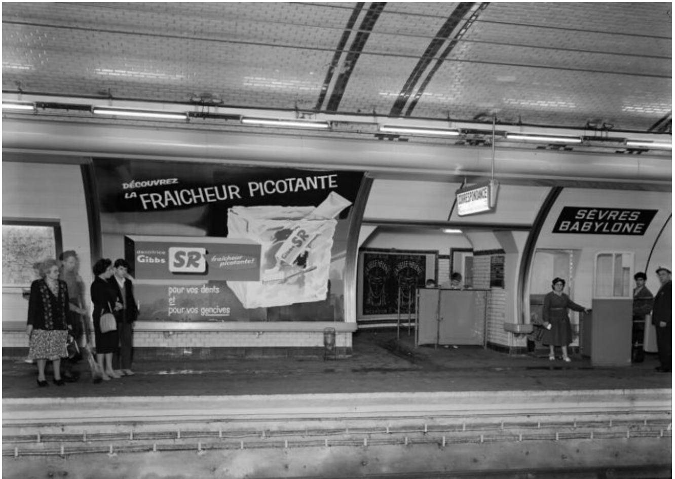
1960 Métro Sèvres Babylone – Paris avant le Grand Remplacement