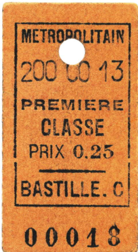
Ticket a` l'unite´ de 1 e`re classe e´mis le 19 juillet 1900 portant le N° 00018

Les carnets de tickets t + magnétiques ou encore le billet Origine/Destination « ne seront également plus disponibles chez les commerçants agréés RATP d'ici la fin de l'année 2021 », explique la RATP sur son site. C'est en mars 2022 que la vente des carnets de tickets prendra fin pour de bon, dans toutes les stations de métro et de RER d'Ile-de-France. Seule exception : le ticket papier à l'unité, à 1,90 euro, sera toujours commercialisé dans les guichets. Passé cette date, il sera toujours possible de valider les tickets t + en carton à l'entrée des stations, et ce, jusqu'en 2025, précise la RATP. Les Echos