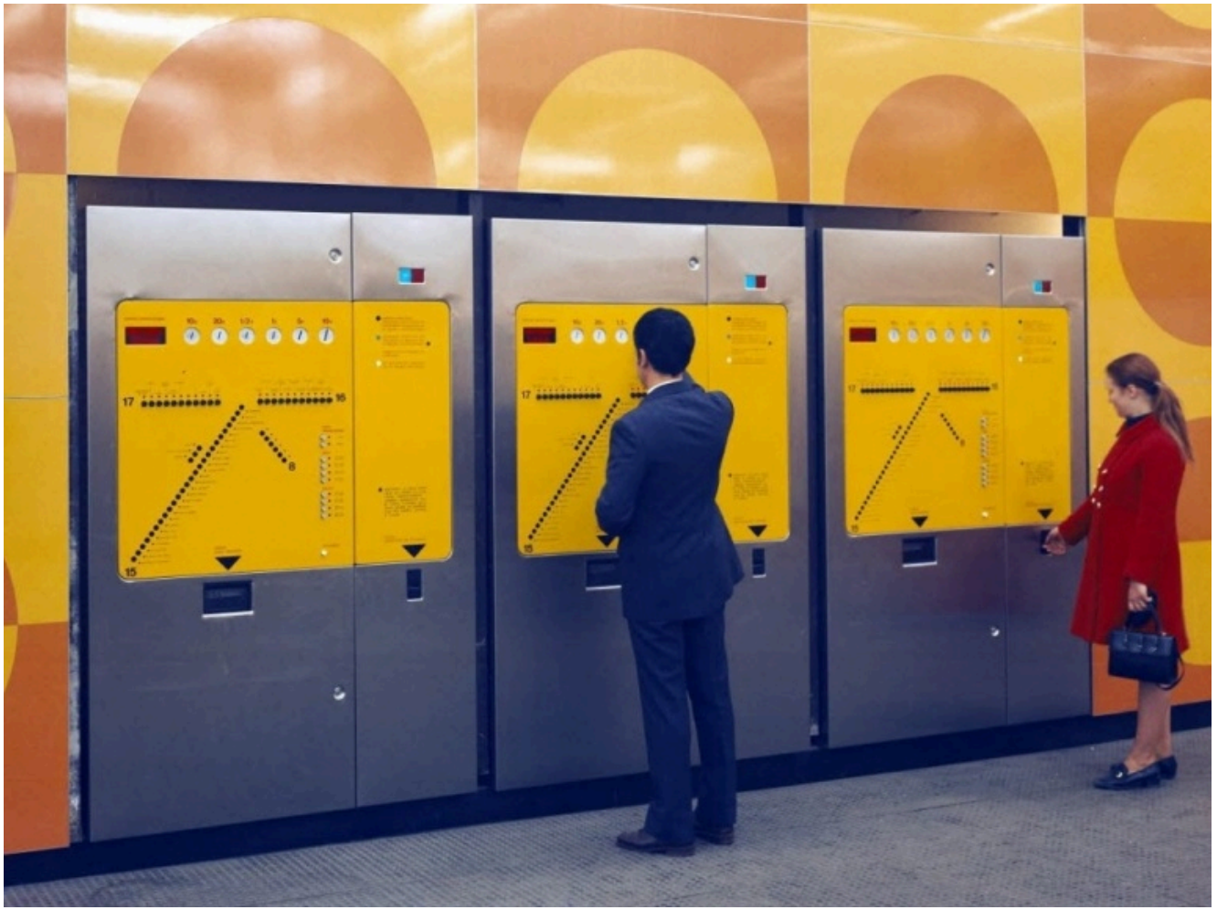
Avec le RER apparaissent aussi les premiers distributeurs automatiques de billets. La photo est prise en avril 1970.