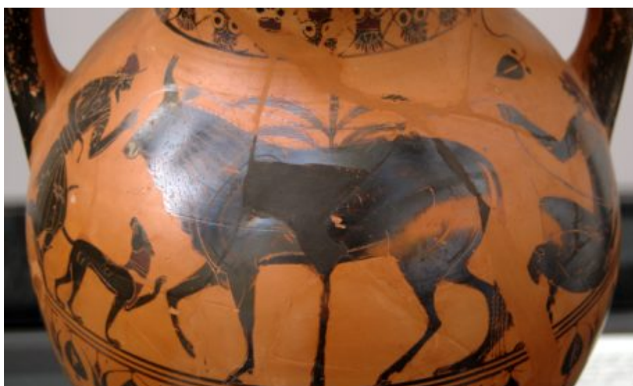
Io, séduite par le même Zeus et transformée par celui-ci en génisse pour échapper à la jalousie d'Héra