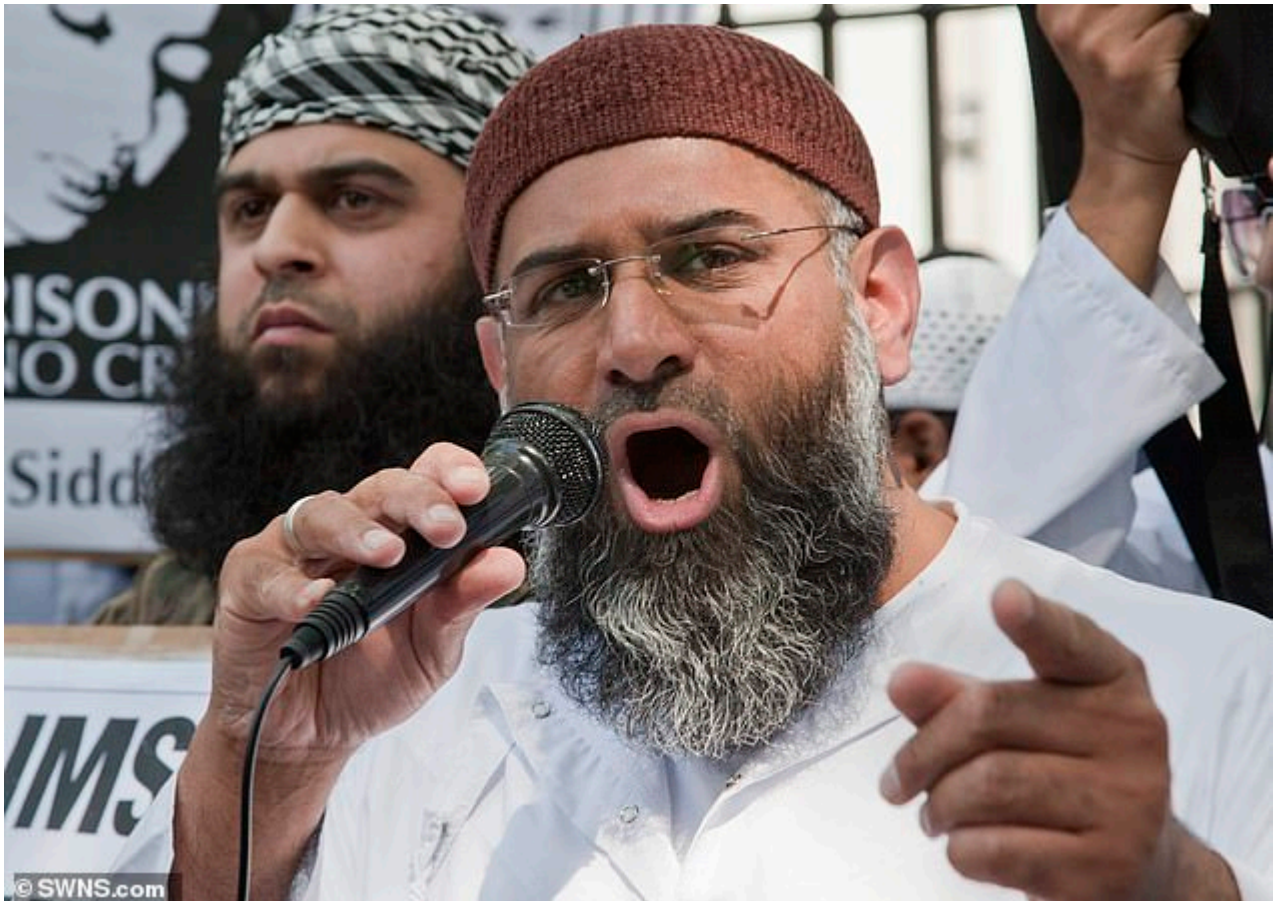
Photo : ici en août 2021, Anjem Choudary exhorte les talibans à être PLUS durs

Tout non-musulman vivant en Afghanistan, dit-il , doit payer une taxe connue sous le nom de « jizya », souvent appelée « taxe des infidèles ». Ce péage leur assure une protection.