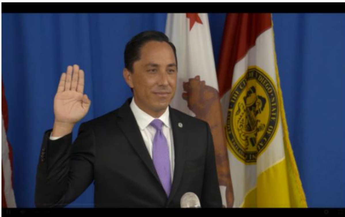
Todd Gloria est entré dans l'histoire en prêtant serment jeudi en tant que maire de San Diego. Il est le premier membre auto-identifié de la communauté LGBTQ et la première personne de couleur à être élue à ce poste.

Aliev, le président de l'Azerbaïdjan adore ce pantin californien qui rampe devant lui :