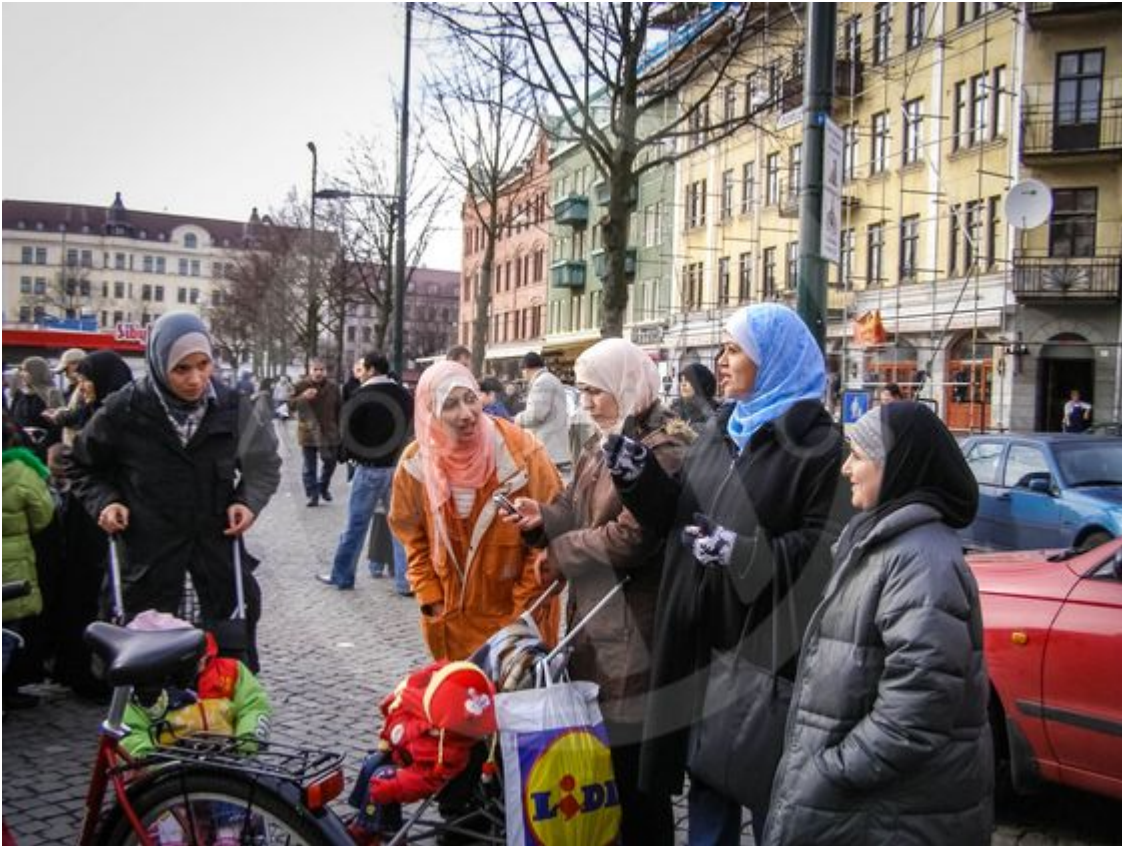
Photo de rue dans Malmö

Dans le même temps, le gouvernement a été critiqué pour le fait que l'antisémitisme à Malmö vient principalement d'immigrés de pays musulmans, et que les lois que le gouvernement veut introduire ne les visent pas.