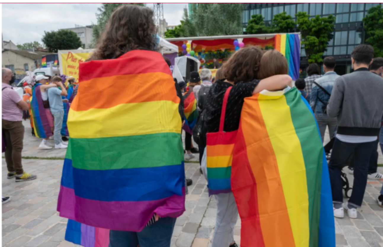
Marche des fiertés à Paris, en juin 2021, pour demander notamment la liberté de changement d'état civil pour les personnes transgenres.