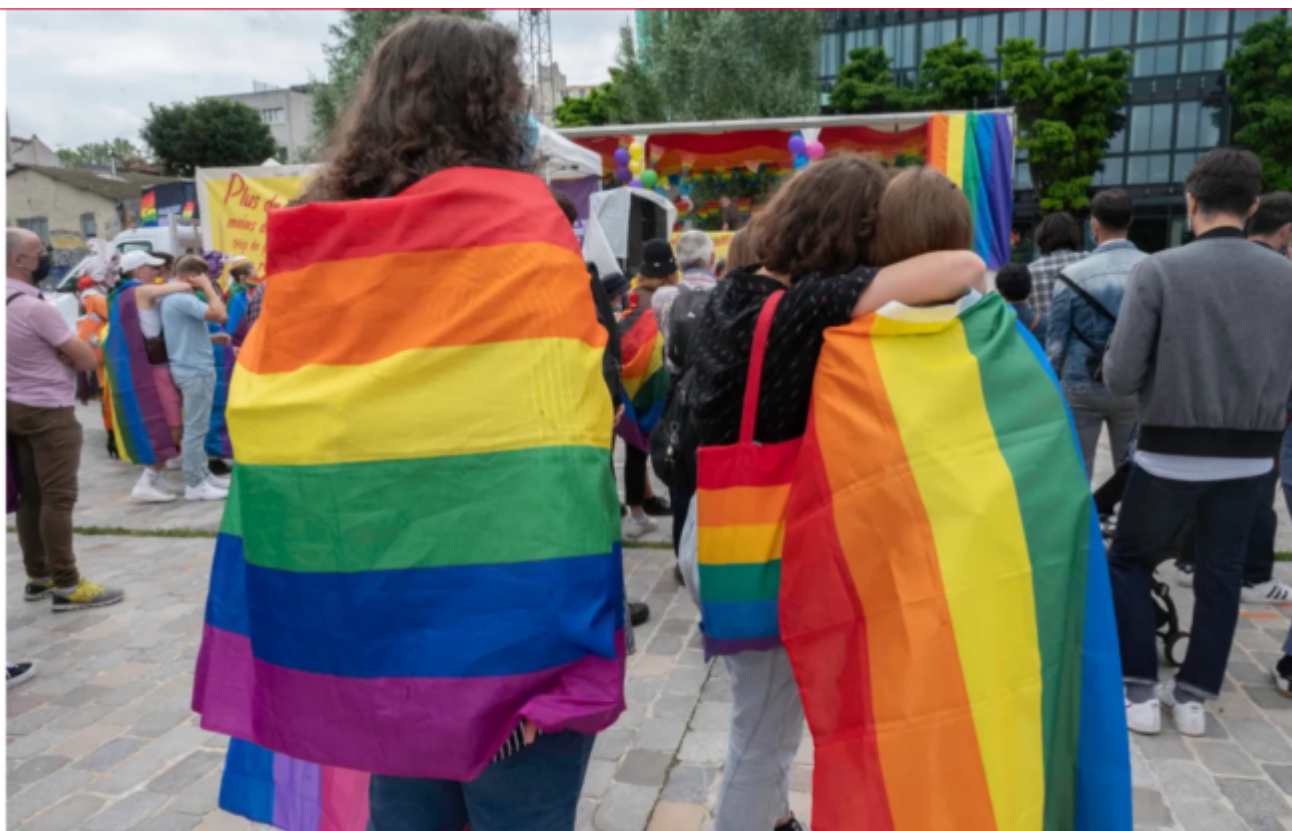
Marche des fiertés à Paris, en juin 2021, pour demander notamment la liberté de changement d'état civil pour les personnes transgenres.