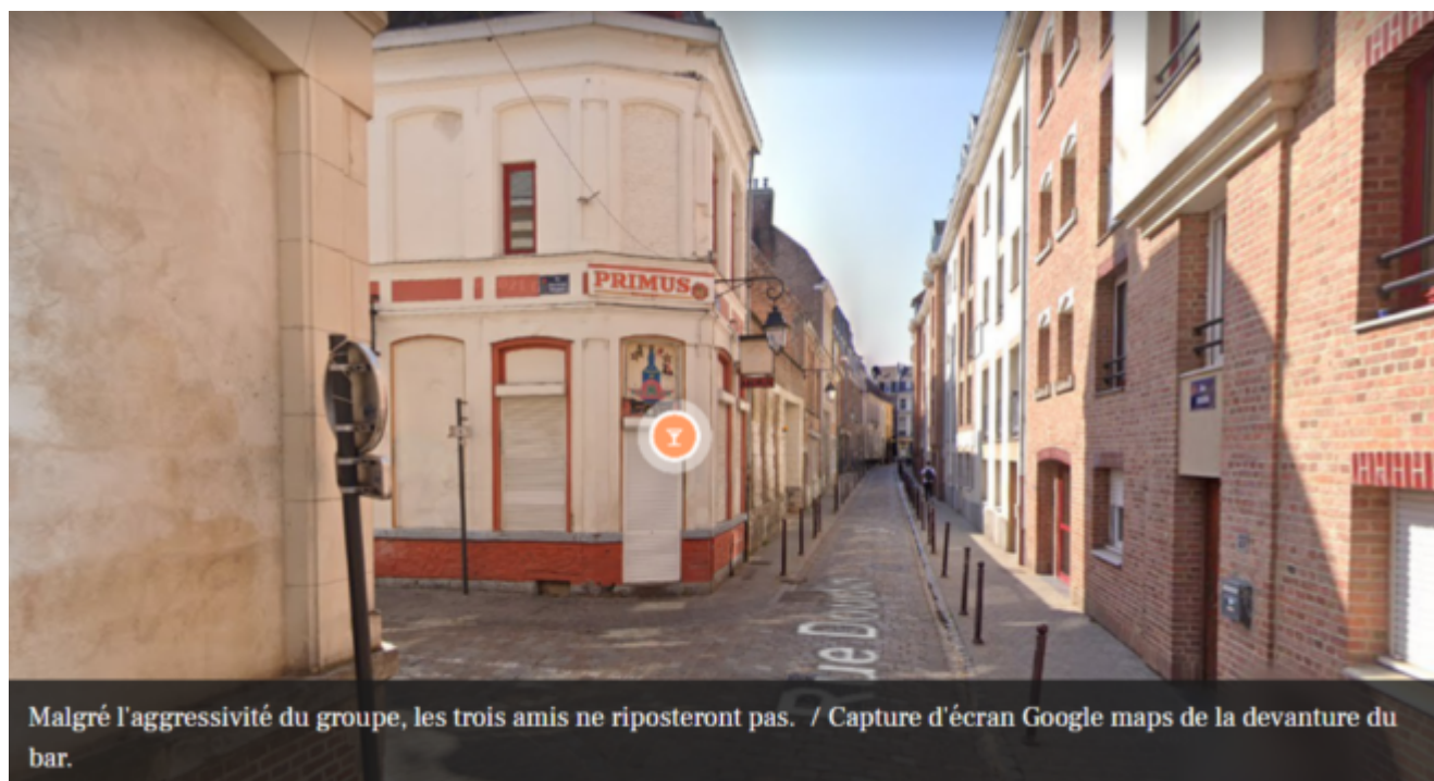
Malgré l'agressivité du groupe, les trois amis ne riposteront pas. / Capture d'écran Google maps de la devanture du bar.

Lille : un prêtre et trois de ses amis agressés par des jeunes « Génération Zemmour »