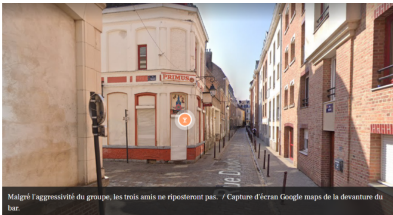
Malgré l’agressivité du groupe, les trois amis ne riposteront pas. / Capture d’écran Google maps de la devanture du bar.

Lille : un prêtre et trois de ses amis agressés par des jeunes “Génération Zemmour”