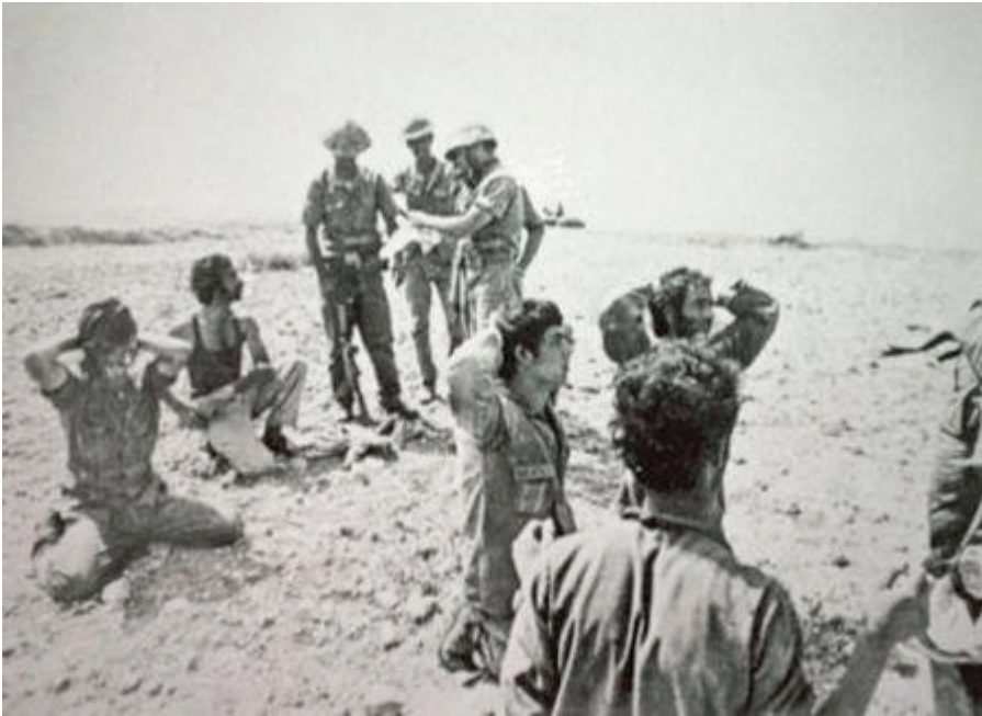
Photo ci-dessus : Cinq soldats grecs qui se rendent à leurs homologues turcs : image symbole de l'intervention turque à Chypre en 1974, instant capturé par un journaliste turc. Personne ne savait ce que ces militaires grecs étaient devenus. Leurs restes ont été identifiés (retrouvés au fond d'un puits).

D'un point de vue culturel et religieux, la Turquie procède à un grand nettoyage. Depuis 1974, 55 églises ont été converties en mosquées alors que 50 monastères et autres édifices religieux sont transformés en hôtels, étables ou tout simplement détruits. Ces actes ont surtout visé des lieux de culte grec-orthodoxe.