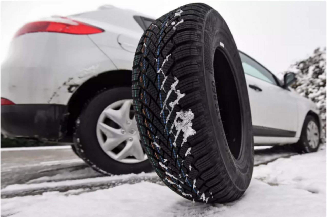
Illustration. Des pneus neige ou des chaînes deviennent obligatoire sur de nombreuses communes de Franche-Comté à partir du 1er novembre et jusqu'au 31 mars.

Encore une loi tordue et ubuesque de plus au pays des Shadocks !