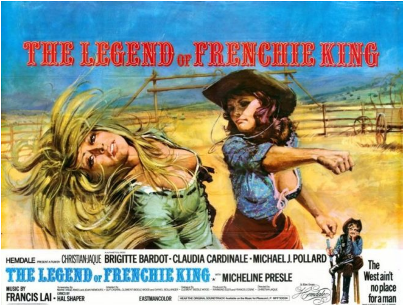
Affiche anglaise des « Pétroleuses » (1971) avec Brigitte Bardot et Claudia Cardinale

.. et la France des banlieues du XXIème siècle.