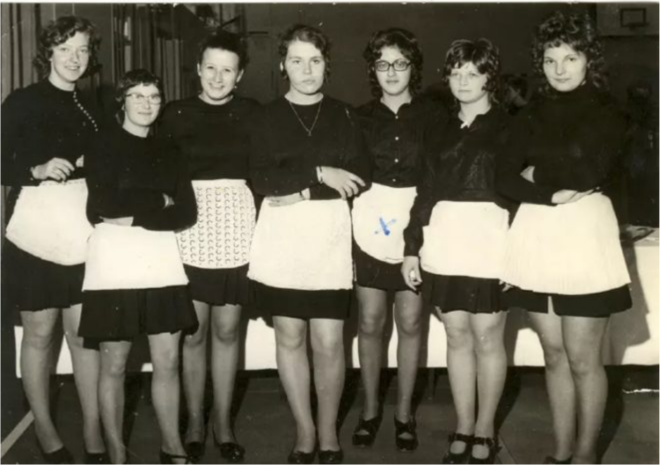
1972 : BEP EH