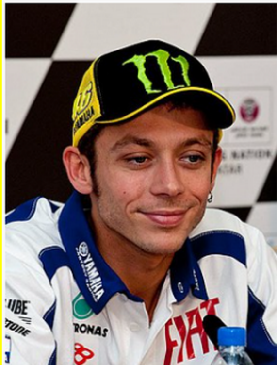
Valentino Rossi en 2010.