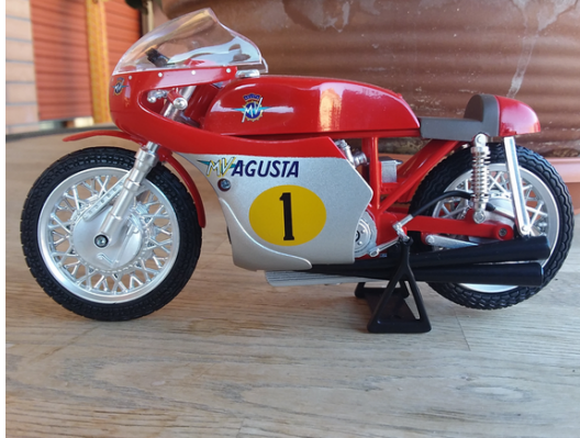
MV Agusta 500cc de Giacomo Agostini