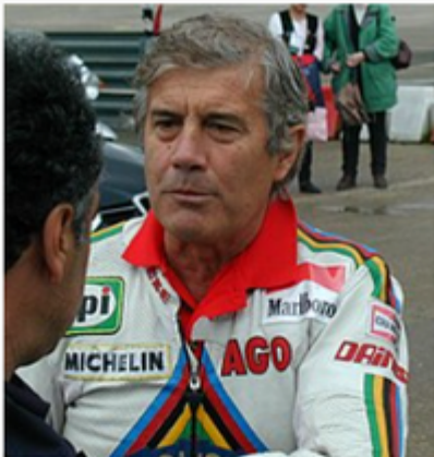
Agostini en 2003 à Monthléry.