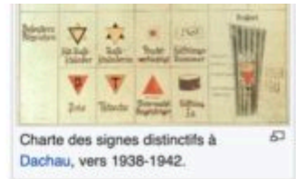
Charte des signes distinctifs à Dachau, vers 1938-1942.