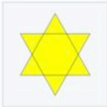
Marquage pour les Juifs. (Étoile de David)