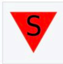
Marquage pour les prisonniers politiques espagnols.