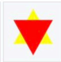
Marquage pour les prisonniers politiques juifs.