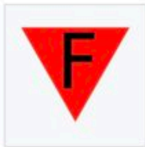
Marquage pour les prisonniers politiques français.