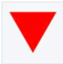
Marquage pour les prisonniers politiques allemands, les résistants et les autres prisonniers politiques, en grande partie les communistes. La première lettre du nom allemand du pays d'origine était ajoutée.