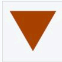
Marquage pour les Tsiganes dans certains camps.