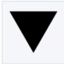
Marquage pour les prisonniers « asociaux », tels que les Tsiganes, les vagabonds, les alcooliques, les prostituées, les lesbiennes, les handicapés 1 , les malades mentaux 2 .