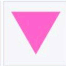
Marquage pour les homosexuels allemands. Ce signe n'a cependant pas été systématiquement utilisé : il n'apparaît qu'en 1937, après la vague la plus massive d'internements des homosexuels, et une partie des internés au titre du paragraphe 175 pénalisant l'homosexualité masculine se sont vu attribuer un autre marquage (triangle bleu, rouge ou noir) en fonction de leur « parcours » judiciaire 3 .