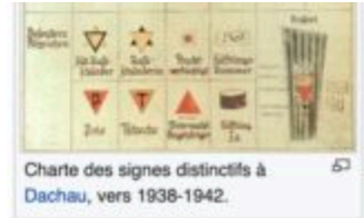
Charte des signes distinctifs à Dachau, vers 1938-1942.