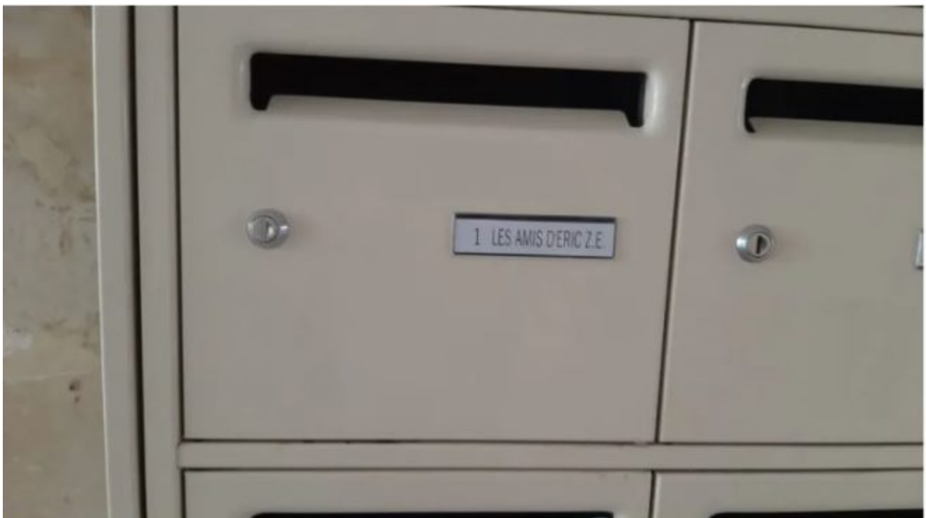
Photo ci-dessous : En fait de scoop, voilà de quoi a accouché la « cellule investigation de Radio France » : une photo de la boîte aux lettres des Amis d'Eric Zemmour, située au 18, rue du Faubourg-Poissonnière.

Ils ne sont pas allés chercher bien loin l'information : l'adresse a été déclarée en toute transparence dans... le