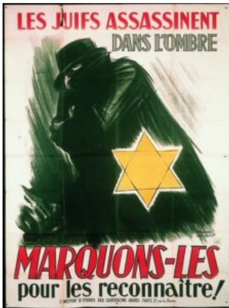
Image Larousse, Affiche antisémite . Voir aussi l'ouvrage : L'AFFICHE ANTISÉMITE EN FRANCE SOUS L'OCCUPATION