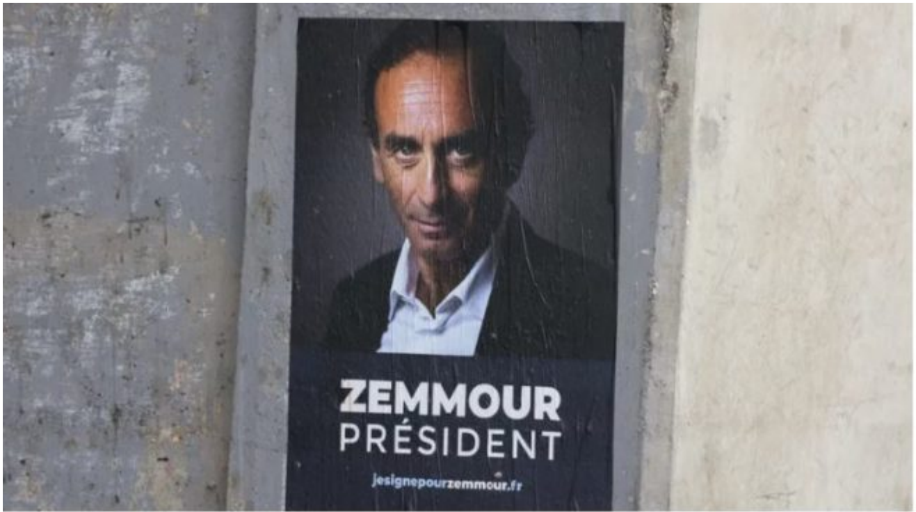
Révélation à propos de Julien Madar, le financier d'Éric Zemmour [photo d'illustration].

Photo ci-dessous : En fait de scoop, voilà de quoi a accouché la « cellule investigation de Radio France » : une photo de la boîte aux lettres des Amis d'Eric Zemmour, située au 18, rue du Faubourg-Poissonnière.