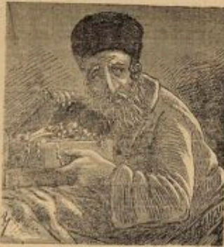
Portrait de Meyer Rothschild.

attribué à la gloire de la fortune. Fervent, toutes gloires, seigneur assés essent de prières et d'opéra ou avec ses mascarades de hochets en dévotion, objets nobles, crocodiles empâtés balancés, suspendus aux pieds l'homme, toutes pour disposer de leur poche, vers les impudiques livres et gravures, boucles ignobles, chemises et madras, porteurs et amorceurs furent dans la com-