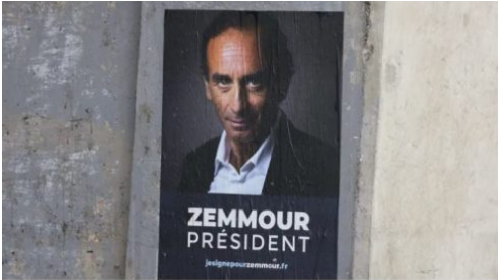
Révélation à propos de Julien Madar, le financier d'Eric Zemmour [photo d'illustration]. © Maxppp - PHOTOPQR/LE PARISIEN/Arnaud

Révélation à propos de Julien Madar, le financier d'Eric Zemmour [photo d'illustration]. ©