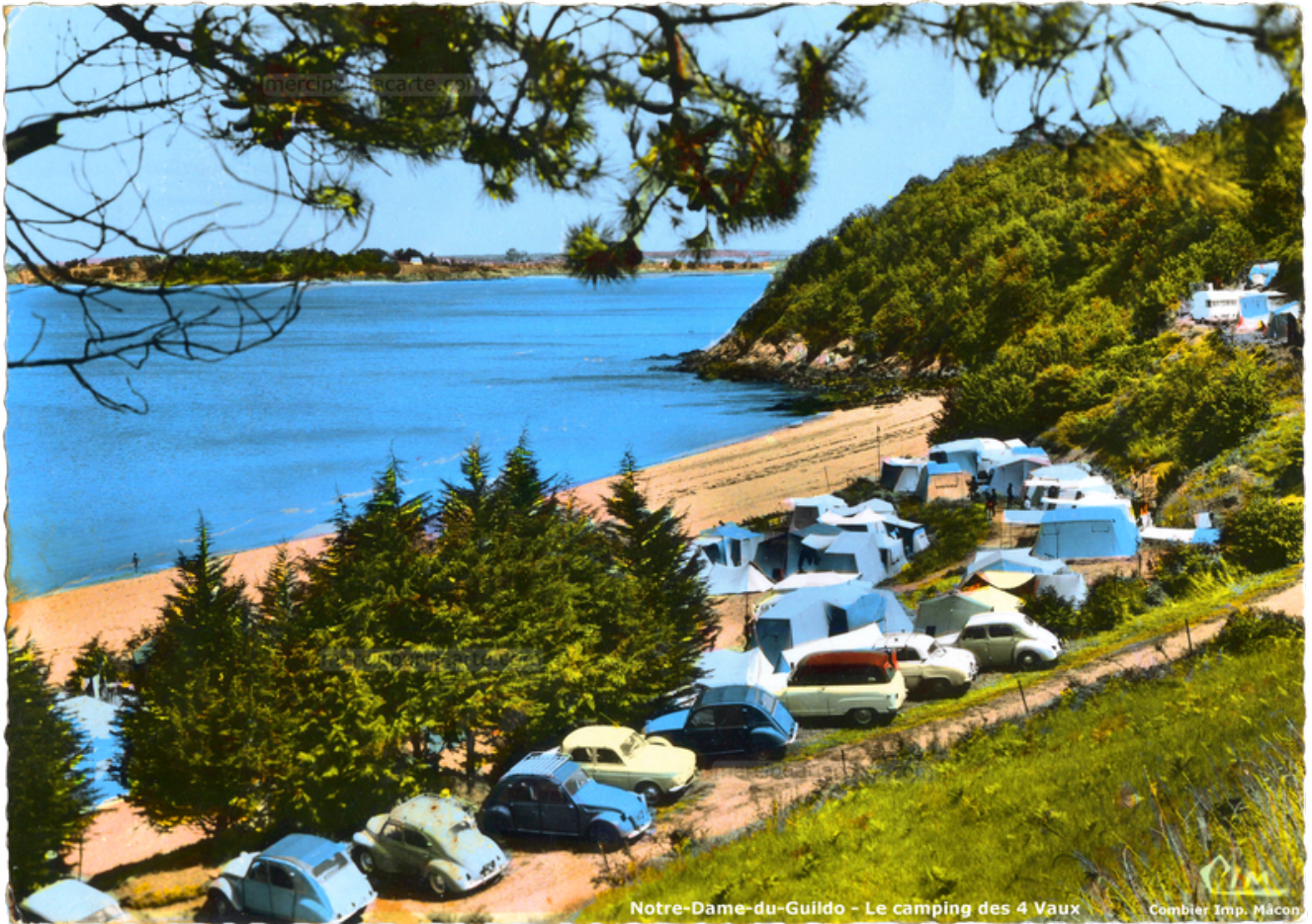
Notre-Dame-du-Guildo – Le camping des 4 Vaux Editions CIM