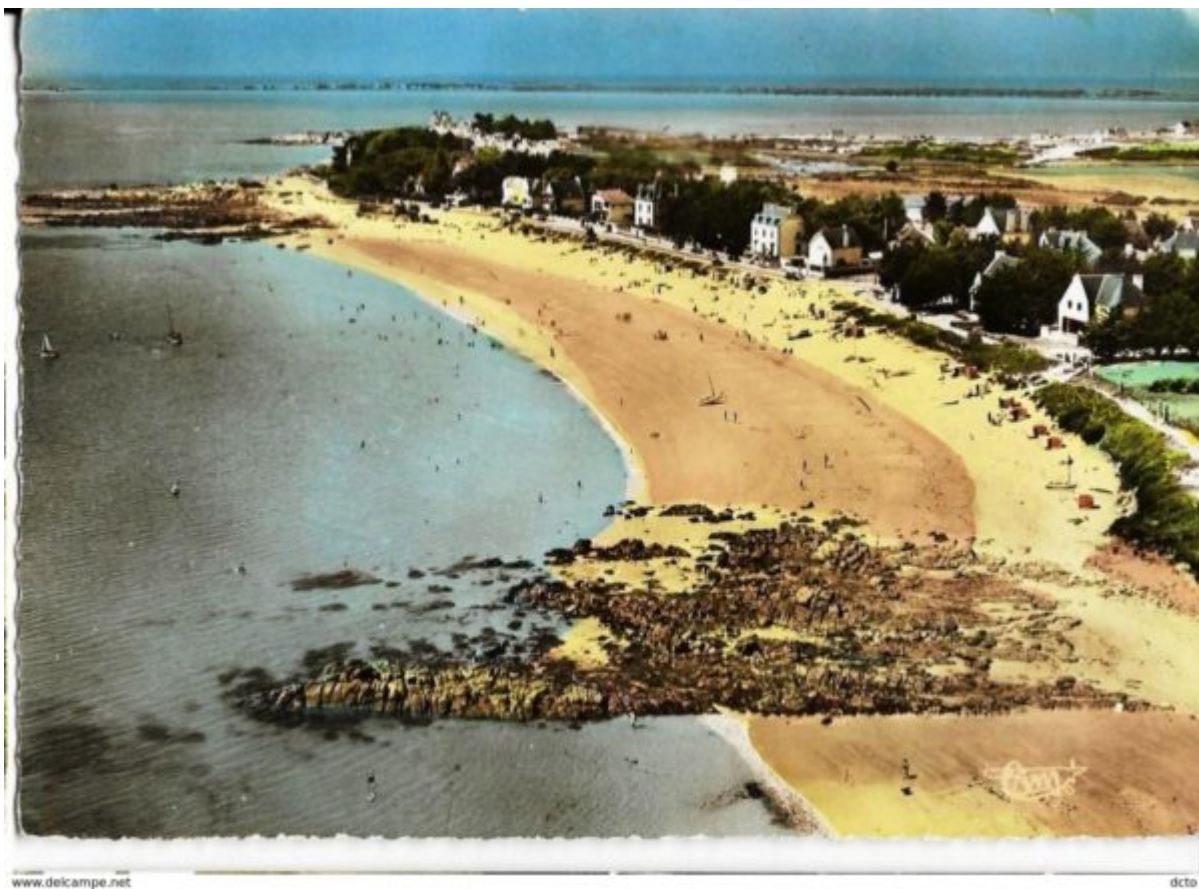
CARNAC Vue aérienne de St-colomban Cim

Avec ces photos aériennes Jean-Marie Combier réalise le rêve qui le nourrit depuis 1919 : avoir au moins une photographie de chaque village de France.