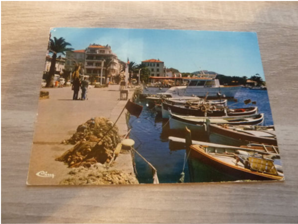
SANARY-SUR-MER – LE QUAI – EDITIONS COMBIER – CIM – ANNEE 1983