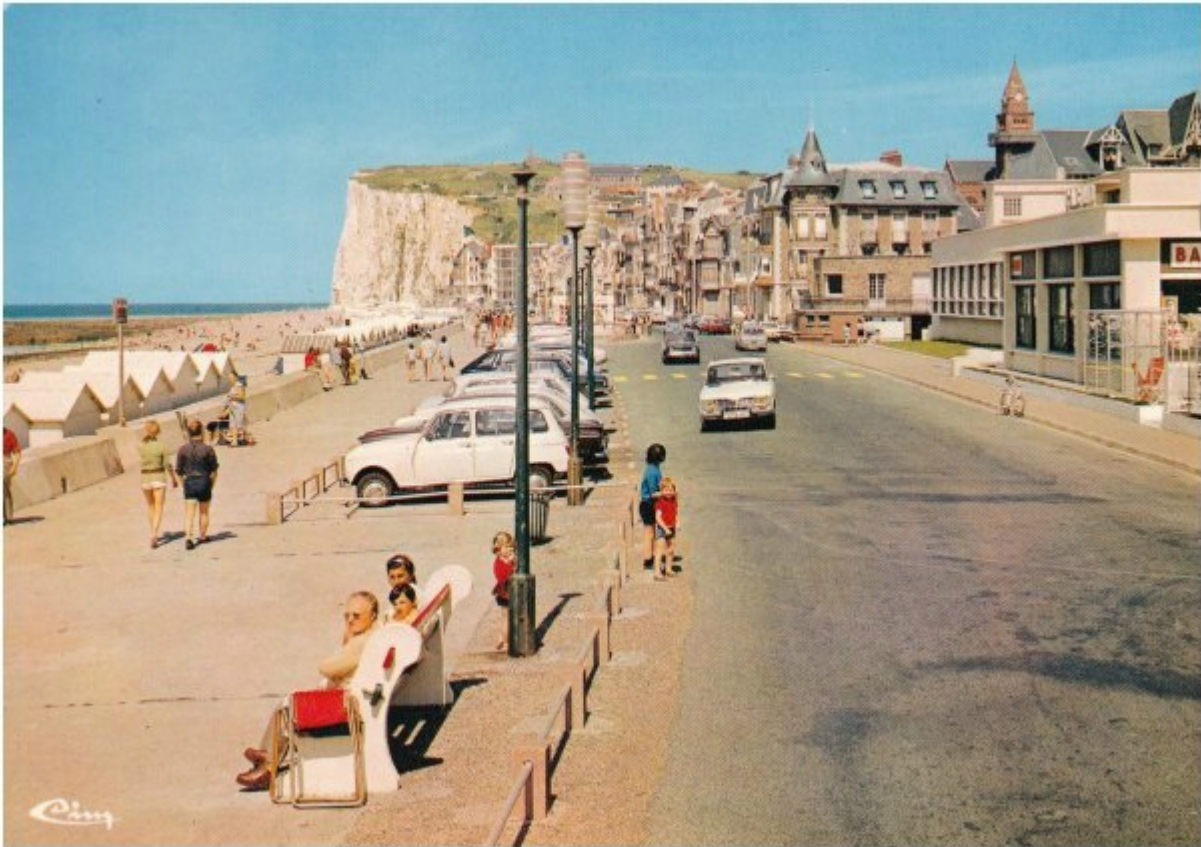
Carte postale de Mers-les-Bains, CIM

Les cartes postales CIM ont été le quotidien des Français pendant des années, ces trois lettres sont les initiales de Combier Imprimeur Mâcon.