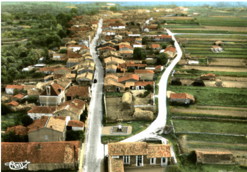
La Taillée (85) – Vue générale aérienne. Marais poitevin