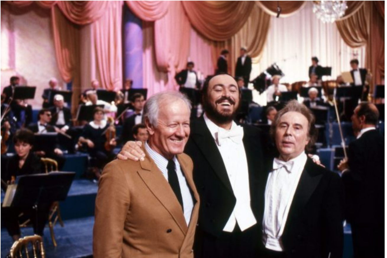
L ne restera