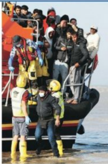
Depuis le début de l'année, 14 000 migrants auraient réussi à débarquer sur les côtes anglaises (ici, mardi à Dungeness). contre 8 000 pour l'année 2020.

Ces tensions sont dues à un nombre record d'arrivées de clandestins traversant la Manche ces derniers mois. Quelque 14 000 migrants auraient ainsi réussi à débarquer sur les côtes anglaises depuis le début de l'année, contre 8 000 pour l'année 2020. Avec une météo favorable, ces tentatives ne sont plus impossibles ces derniers jours. En juillet, Londres et Paris se sont mis d'accord pour déployer plus de forces de police et investir dans des technologies de détection pour créer une «frontière intelligente». Mais la France a rejeté la proposition britannique de créer un «centre de commandement conjoint unique», avançant des questions de souveraineté et une coordination qui fonctionnerait déjà efficacement. Priti Patel