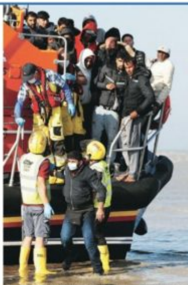
Depuis le début de l'année, 14 000 migrants auraient réussi à débarquer sur les côtes anglaises (ici, mardi à Dungeness), contre 8 000 pour l'année 2020.

Ces tensions sont dues à un nombre record d'arrivées de clandestins traversant la Manche ces derniers mois. Quelque 14 000 migrants auraient ainsi réussi à débarquer sur les côtes anglaises depuis le début de l'année, contre 8 000 pour l'année 2020. Avec une météo favorable, ces tentatives ne sont les dernières ces derniers jours. En juillet, Londres et Paris se sont mis d'accord pour déployer plus de forces de police et investir dans des technologies de détection pour créer une « frontière intelligente ». Mais la France a rejeté la proposition britannique de créer un « centre de commandement conjoint unique », avançant des questions de souveraineté et une coordination qui fonctionnerait déjà efficacement. Priti Patel