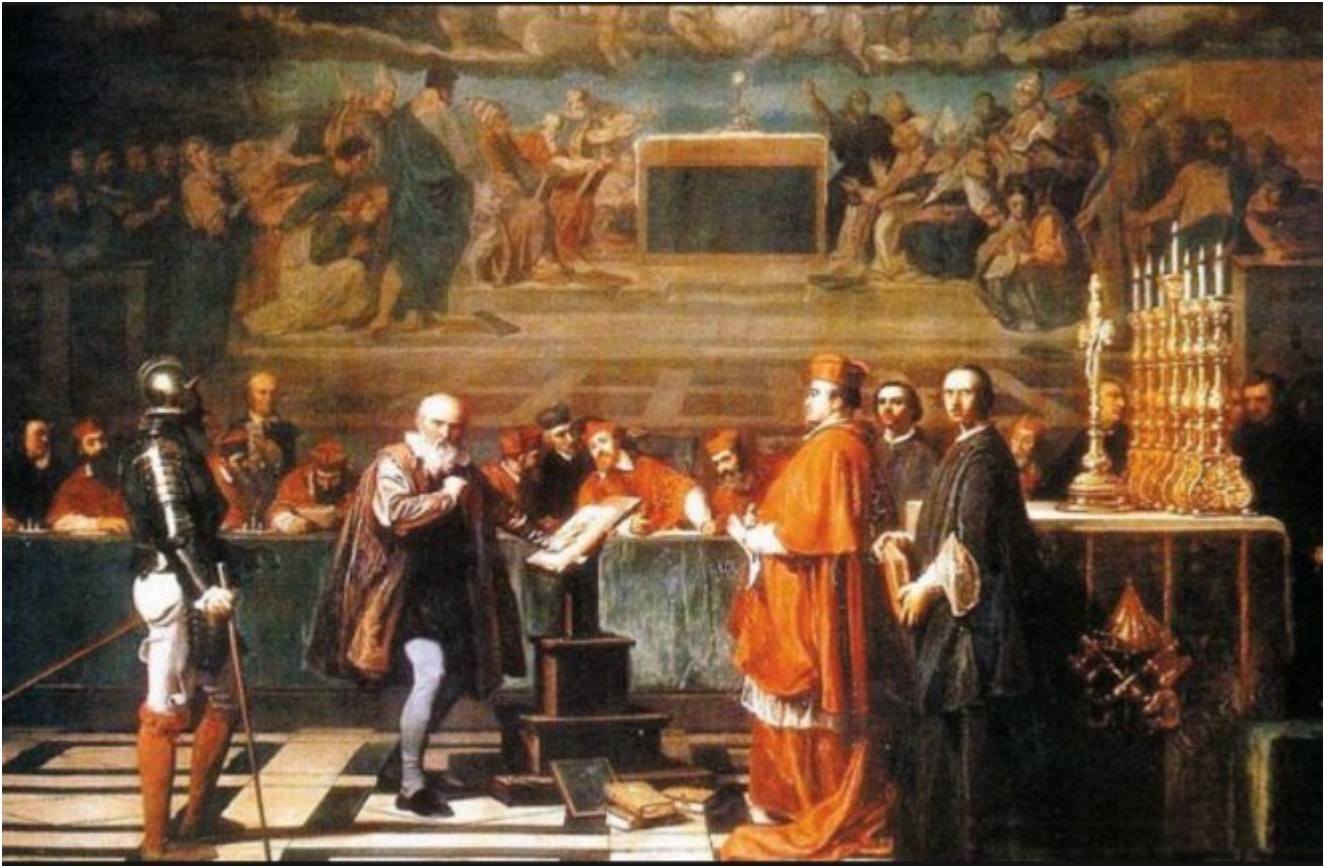
Illustration : le procès de Galilée par l'Église catholique. D'ailleurs, la comparaison avec Galilée et l'Eglise est plaisante.